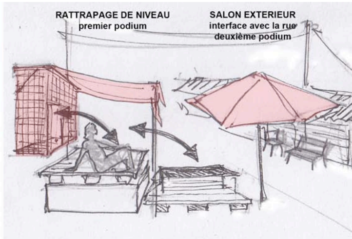
2007: appropriation extensive du domaine public : multiplication des niveaux jusqu'à la rue Klong Toey (Damronglatta Phiphat Road, emprise PAT)

2012: le même « sur-balcon » consolidé et agrandi Klong Toey (Damronglatta Phiphat Road, emprise PAT)