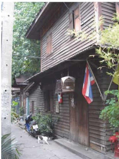
habitat spontané ANCIEN

Nous avons analysé l'habitat spontané dans sa dimension processuelle : il s'agissait d'identifier les contextes d'apparition de l'habitat spontané dans l'espace métropolitain, les facteurs qui en expliquent la consolidation et l'évolution, ainsi que le changement de son image au fil du temps. Cette méthodologie transversale peut être employée pour d'autres métropoles, et met en exergue à Bangkok trois grands contextes d'émergence – ou « configurations » – chacun proposant des enjeux et un intérêt propre pour la conception urbaine : l'habitat spontané « ancien », « pur » et « greffé » (voir figure 1).