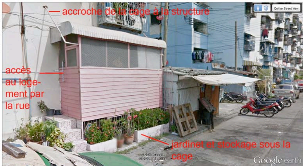
Figure 2 : Principe d'évolution d'une greffe spontanée sur un immeuble de logement social