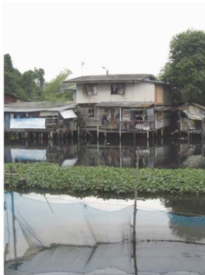
habitat spontané PUR

préexistant à la fondation de Bangkok comme capitale, transformé progressivement