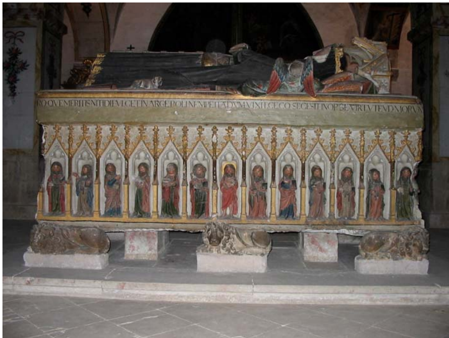
Figura 2 – Túmulo de D. Isabel de Aragão. Coimbra, igreja do mosteiro de Santa Clara-a-Nova, coro baixo