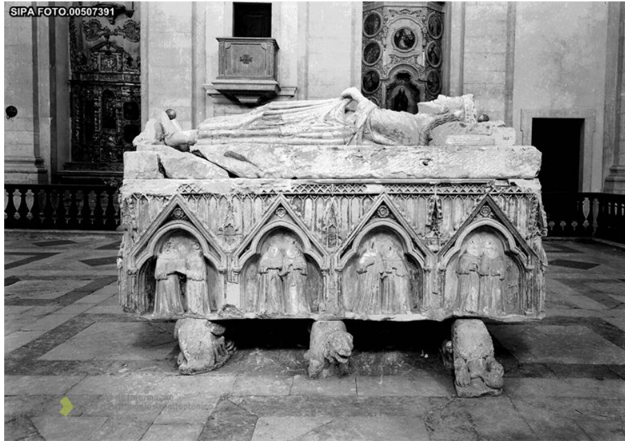
Figura 1 – Túmulo do rei D. Dinis. Odivelas, igreja de S. Dinis, hoje na capela do Evangelho