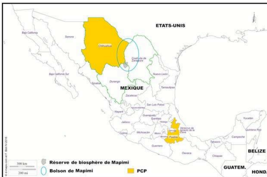
Figure 1 - Carte de localisation des terrains d'étude du Programme PCP et du Bolsón de Mapimi

L'analyse des discours et des pratiques repose sur l'étude de documentations institutionnelles et scientifiques, sur la politique de conservation et tout particulièrement sur les réserves de biosphère au Mexique, des observations directes et participantes lors de réunions organisées dans la réserve et sur des entretiens compréhensifs conduits entre 2014 et 2016 auprès de scientifiques de l'INECOL et du CNRS, d'institutions et d'habitants dans l'espace de la réserve de biosphère de Mapimi ainsi qu'aux alentours proches dans le cadre de relations entre scientifiques Mexicains et Français ayant conduit à la réalisation d'un film sur les réserves de biosphère pour le compte de l'UVED.