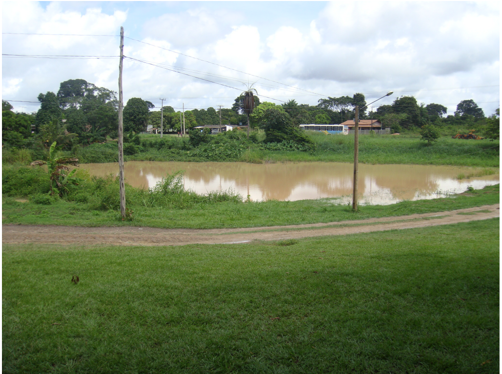
Figura 3 - "Poço" pré-colombiano na comunidade Cipoal, Santarém/PA