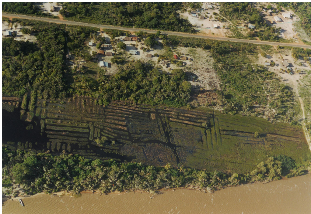
Figura 1 - Campos agrícolas elevados de Piliwa, costa ocidental da Guiana Francesa