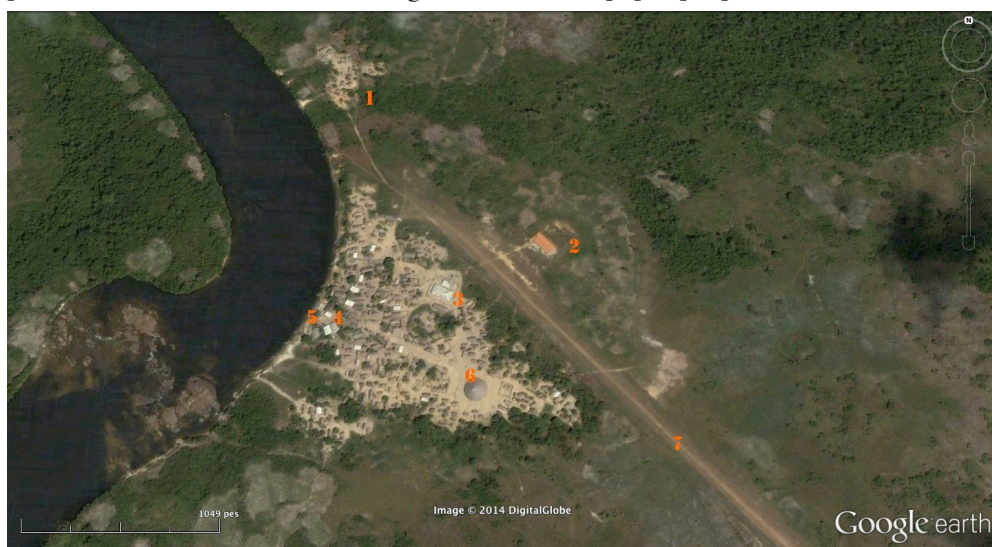
Mapa (5) da aldeia Mapuera: 1) “Bairro” Katuena; 2) Escola; 3) “Igreja”; 4) Posto de Saúde; 5) Posto da Funai; 6) Casa Grande (Umaná); 7) Pista de Pouso.

Mapuera, sempre possuíram roças separadas, relativamente distantes da aldeia, que funcionavam como uma espécie de “aldeia temporária”. Ali, mantinham uma relativa independência, passavam boa parte da vida cotidiana e elegiam seus locais de caça e coleta. Dessa forma, tais subgrupos puderam desfrutar de uma espécie de “autonomia” do grupo local, sem se submeter aos caciques gerais da aldeia Mapuera, ao seu ritmo coletivo e supraétnico, no qual a identidade maior, denominada Waiwai, mantinha-se como inibidora das diferenças e das “identidades” específicas dos subgrupos. Ou seja, a aldeia Mapuera, nesse caso, funcionou (e ainda funciona) como aldeia central (e as roças, como aldeias satélites), lugar de convergência para as atividades coletivas — em geral, de conteúdo ritual ou político —, onde os cultos evangélicos têm um papel preponderante.