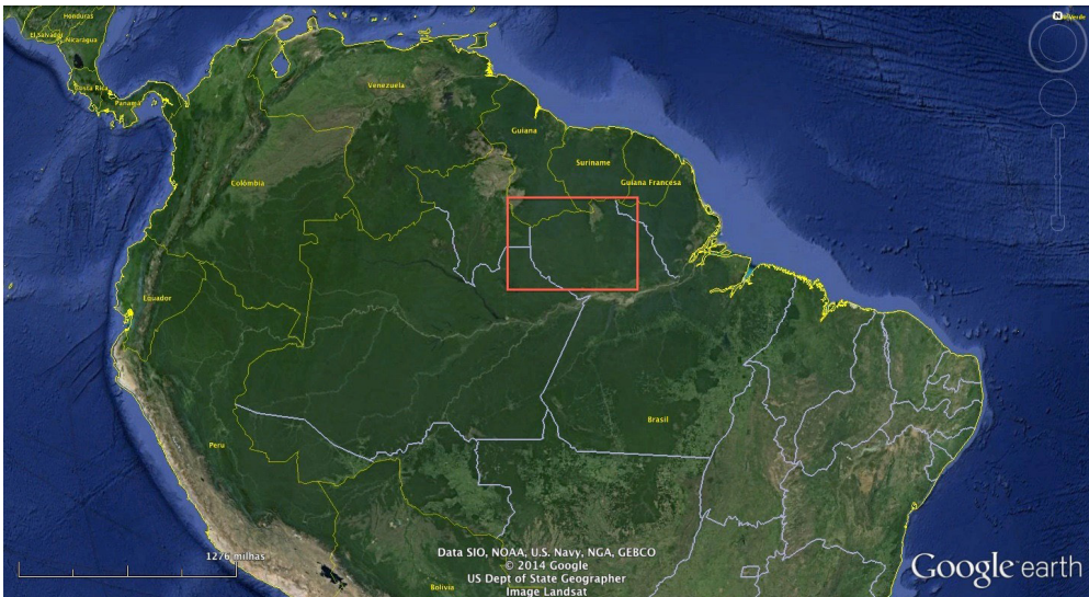
Mapa (1) da Área Etnográfica Tarumã-Parukoto, localizada (no contorno laranja) na Amazônia Setentrional.