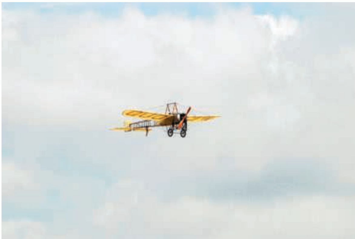
Meeting aérien : 100 ans de la base aéronavale de Palyvestre, 13 juin 2010

utopie réaliste. Corps et machines à jamais associés dans la conquête de la vitesse en ces premiers temps de l'âge industriel : « Nous avons des ailes ! [...] N'est-ce pas que vous avez comme moi cette vision affolante que l'homme a des ailes maintenant ? Qu'il les ouvre donc toutes grandes, qu'il vole enfin puisqu'il lui est permis de ne plus ramper. Voici des ailes qui nous poussent, encore inhabiles et imparfaites, mais des ailes tout de même. C'est l'ébauche qui s'améliorera jusqu'au jour où nous planerons dans les airs comme de grands oiseaux tranquilles. [...] Vous qui enviez les oiseaux libres, vous qui cherchez des dieux derrière les nuages, vous qui jetez vos rêves et vos prières aux étoiles lointaines, voici, à portée de votre main, voici des ailes pour assouvir votre idéal » (Leblanc 1898 : 87).