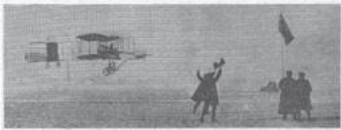
La grande aventure de l'aviation commence, en France, dans les années 1908-1909. Au cœur de ce nouvel espace mental, un pionnier, Henry Farman, est le premier aviateur à voler durant un kilomètre en circuit fermé, le 13 janvier 1908.

et diffusent le modèle d'un homme nouveau, rapide, aventureux, ouvert sur le progrès (Caron 1985 : 357). Ils ont, entre eux, des « affinités structurales » (Bourdieu 1981 : 133-167) et composent des mouvements sociaux, nés les uns des autres, qui modifient en profondeur « l'âme et le corps ». Symbolisant l'esprit nouveau, ils créent, à l'intérieur d'une époque « enfiévrée de progrès », une révolution mécanique et industrielle mais aussi physique et morale (Weber 1986).