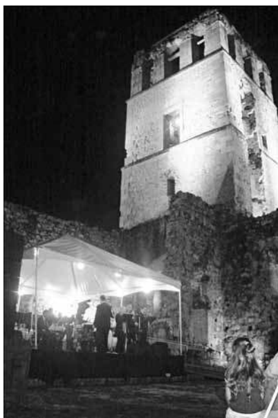
Imagen 1. Actividades culturales en las ruinas de la antigua catedral. Al fondo, la torre de la catedral, símbolo de identidad de Panamá.

A partir del año 2000 se inició el proyecto más emblemático de la institución: la Consolidación de la Catedral de Panamá Viejo y su consecuente transformación en un mirador (ver imagen 1). Este proyecto incluyó en 2006 la recuperación del entorno de la Catedral como atractivo principal del núcleo oeste del Conjunto Monumental (Arango et al. 2007).