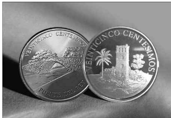
Imagen 2. Monedas conmemorativas de 25 centésimos de balboa. El Puente del Rey y la Torre de la catedral de Panamá Viejo.

Otra iniciativa desarrollada por el Comité de Finanzas fue entablar negociaciones con distintos operadores de turismo, a quienes se les ofrecen tarifas especiales para incentivar la visita al sitio, a fin de lograr un mayor volumen de visitantes y aumentar las recaudaciones. En 2011 el sitio recibió 63.946 visitantes, entre nacionales y extranjeros.