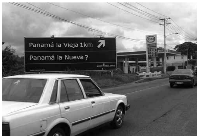
Imagen 3. La presión inmobiliaria de los últimos años sobre el sitio: el riesgo latente (foto de Juan G. Martín).

como la recuperación e interpretación del marco de la Plaza Mayor, la continuidad de su programa de conservación preventiva y el desarrollo de su proyecto arqueológico han comenzado a ampliarse, en cuanto a investigación, asesoría y consultoría, en los niveles local y regional (ver imagen 3).