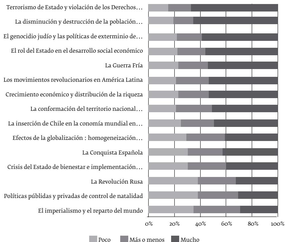
Imagen 1. “Temas controversiales” ordenados según el porcentaje de mayor conflictividad declarada por los estudiantes

Nota: cada barra representa la distribución en porcentaje de la calificación según grado de conflictividad atribuido a cada tema.