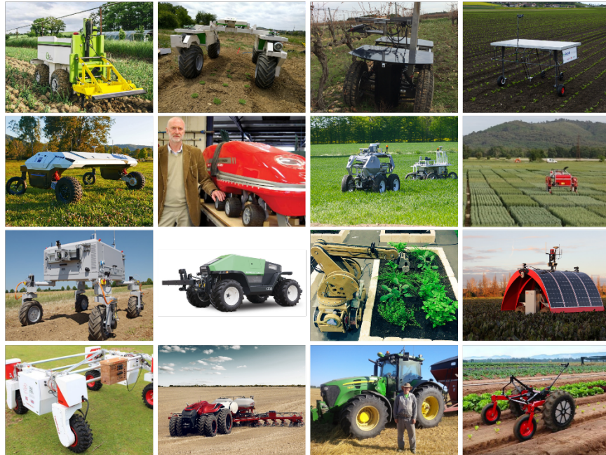
Figure 2. Une sélection de propositions pour l'agriculture robotiques (de gauche à droite à partir du haut) : Oz (Naïo Technologies, commercialisé) ; Dino (Naïo Technologies, commercialisé) ; MYCE (Wall-ye, commercialisé) ; ecoRobotix (commercialisé) ; AgBot II (Australian Centre for Robotics Vision, projet de recherche) ; Harper Adams University (projet de recherche) ; IRSTEA (projet de recherche) ; Phénomobile (HiPhen, commercialisé) ; BoniRob (Deepfield Robotics/Bosch, projet de recherche) ; Greenbot (Precision Makers, commercialisé) ; Bot2Karot (projet de recherche) ; Ladybird (University of Sydney, projet de recherche) ; Thorvalds (Norwegian University Of Life Sciences, projet de recherche) ; Case IH Autonomous Vehicle Concept (Case IH) ; Open Source autonomous tractor (Matt Reiner) ; Digital Farmhand (Australian Centre for Field Robotics, projet de recherche).

Un projet qui aborde le problème différemment est FarmBot (Figure 3). Ce projet est ancré dans la culture DIY et fab lab, et cet angle d'attaque a permis de se débarrasser d'un certain nombre d'idées préconçues sur les robots existants. C'est un outil léger en aluminium, loin des engins classiques et lourds, en acier. Sa conception est en Open Hardware 4 et utilise des composants