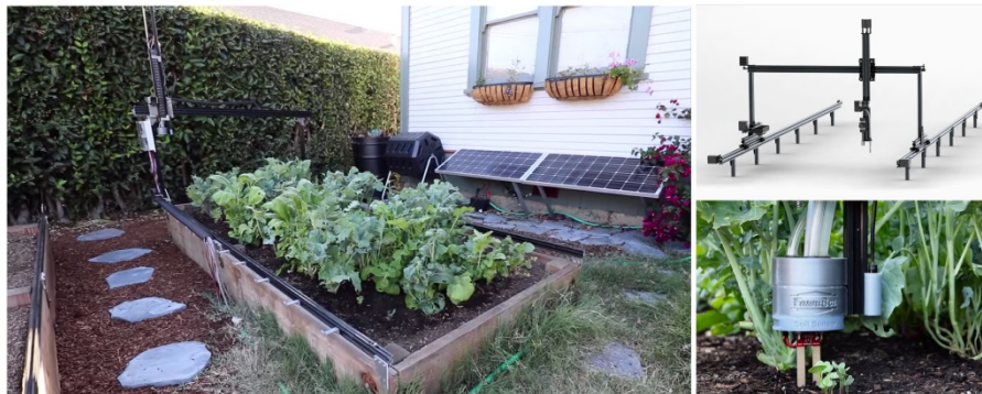
Figure 3. FarmBot utilise un contrôle numérique pour placer des outils (semer, arrosoir, pince de désherbage, capteur d'humidité du sol) dans un espace de travail fixe.

standards, notamment des éléments qu'on trouve dans les imprimantes 3D et les fraiseuses numériques. Cela lui permet de proposer un prix qui est près de dix fois inférieur au prix des solutions concurrentes, mais, surtout, c'est un outil numérique qui permet de travailler de manière précise en trois dimensions et qui accepte une organisation spatiale des cultures sans contraintes. Il gère aussi bien les polycultures que les monocultures. Les interventions mécaniques sont précises et demandent peu d'énergie. FarmBot propose une intégration complète avec un logiciel de gestion des cultures. Sa conception modulaire lui permet d'échanger les outils automatiquement et il peut semer, désherber, arroser et suivre des cultures par caméra. L'objectif de FarmBot est d'offrir un outil avancé aux particuliers pour la gestion d'un petit potager, de l'ordre de quelques mètres carrés. Sans doute, les agriculteurs n'y voient qu'un jouet, mais les points positifs soulevés ci-dessus ne sont pas restreints aux petites surfaces.