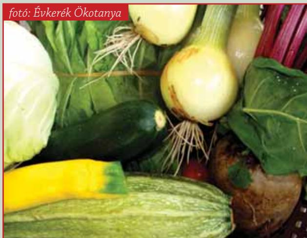
fotó: Évkerék Ökotanya