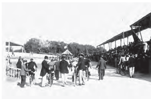
Figura 9 – O velódromo D. Carlos, inaugurado em Algés em Julho de 1896.