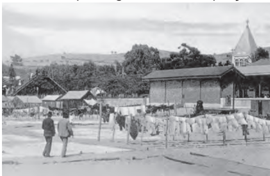
Figura 6 – A estação de caminho de ferro de Algés, contígua à praia e situada em frente ao Chalet Miramar rodeado da sua romântica vegetação, no verão de 1910.

A primitiva estação de Algés situava-se mesmo defronte do Chalet de Miramar 29 , no Largo da Estação, estando contígua à praia (Figuras 6 e 7). A companhia concessionária deste ramal de caminho de ferro, divulgou pela primeira vez, em Agosto de 1891, no seu órgão de informação próprio ( Gazeta dos Caminhos de Ferro ), a venda de maços de bilhetes por zonas e com preços reduzidos, válidos para ida e volta, com a condição de serem utilizados na primeira vigem matutina a partir de cada um dos extremos da via férrea 30 . Esta inovação deverá ter-se tornado popular entre aqueles que não dispunham de recursos para uma temporada de veraneio deslocados da sua habitação permanente, pois permitia ir e voltar em pouco tempo a preços acessíveis. Em 1894 a Companhia de Caminhos de Ferro deu um novo impulso à captação de passageiros com destino a Algés, com a criação de bilhetes de banhos de mar para grupos de cinco ou mais passageiros, ainda a preços mais reduzidos 31 .