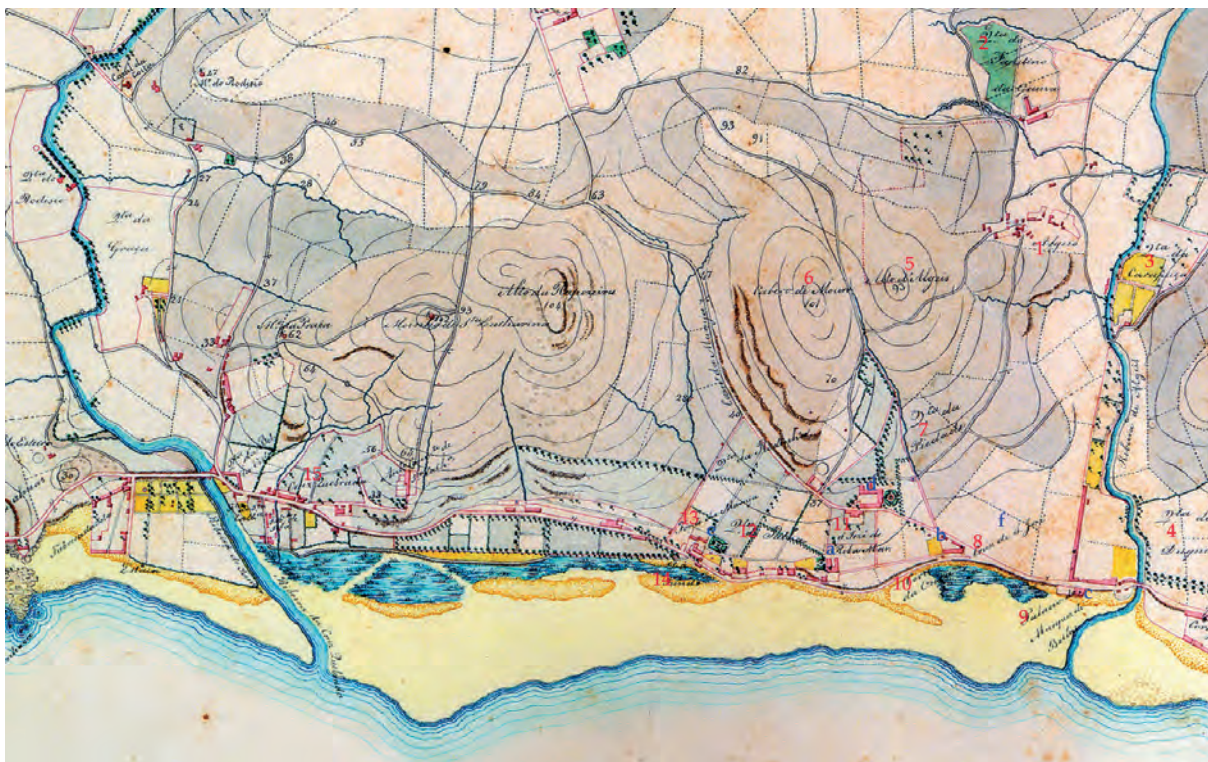
Figura 2 – Pormenor da Carta Corográfica do Reino – Folha de Oeiras , elaborada pela Comissão para os Trabalhos de Triangulação Geral e Levantamento da Carta Corográfica do Reino, por José Carlos Conrado Chelmicky, escala 1: 10 000, c. 1848 (?).

Através de carta corográfica com datação provável de 1848 (Figura 2), confirmamos a localização dos três edifícios acima referidos (tendo estes já outras utilizações), assim como a localização da quinta da Piedade. A povoação de Algeis , ocupando o seu lugar sobranceiro, era um território com alguma expressão em termos de número de construções.