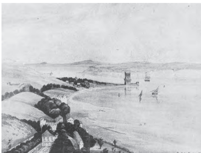
Figura 3 – A encosta de Algés e o extenso areal que vai de Ribamar a Belém, onde está a Torre de Belém, em 1851. Para além da Torre de Belém estão as elevações que formam a margem esquerda do rio Tejo.