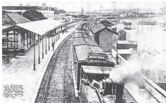
Figura 7 – Comboio a vapor na estação de caminho de ferro de Algés - contígua à praia -, em 1910.