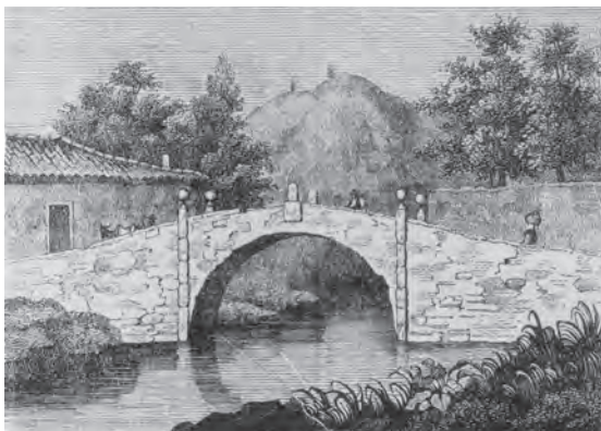
Figura 4 – A ponte de Algés, construída em 1608, em gravura de 1848.