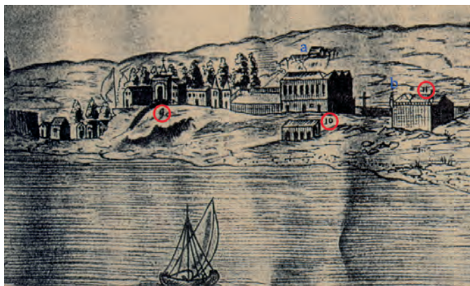
Figura 1 – Algés em 1763. Reprodução parcial de uma vista panorâmica da margem norte do rio Tejo, existente numa colecção particular alemã.

Ao analisarmos o território ribeirinho da actuais localidades de Algés e Dafundo, nos séculos XVIII e XIX, quer através de cartografia quer de iconografia, assinalamos que parte das terras eram utilizadas para cultivo, existindo algumas quintas e um reduzido número de edificações.