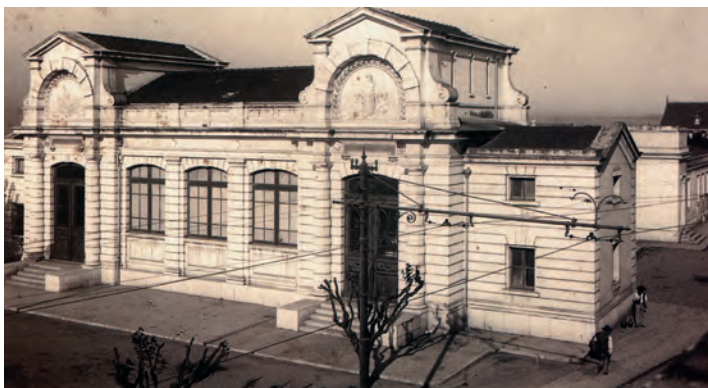
Figura 10 – O Aquário Vasco da Gama pouco tempo depois da sua inauguração, ocorrida em 1898.

Em 1898 foi inaugurado, pela Sociedade de Geografia de Lisboa, o Aquário Vasco da Gama (Figura 10), assinalando o quarto centenário da descoberta do caminho marítimo para a Índia. Foi a comissão executiva destas comemorações a grande impulsionadora da construção deste organismo, em terreno cedido pelo Ministério das Obras Públicas 44 . A instituição, dedicada ao estudo do mar, passou em 1902 para a tutela do Ministério da Marinha, que o entregou em 1909 à Sociedade Portuguesa de Ciências Naturaes 45 . O Aquário, que estava aberto todos os dias da semana, sofreu alterações no seu traçado por ocasião da construção da Estrada Marginal, em 1940, ano em que uma ala do edifício foi cortada e alguns terrenos anexos foram destinados à nova via (Figura 11).