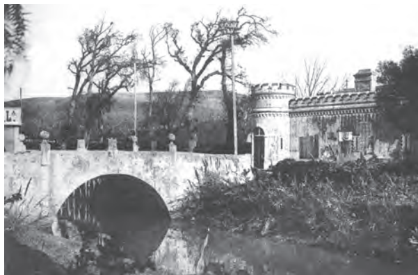
Figura 5 – As ponte e as portas aduaneiras de Algés.

Localizado na margem direita da ribeira de Algés, o lugar com o mesmo nome era, em finais do terceiro quartel de oitocentos, um dos mais aprazíveis sítios dos arrabaldes de Lisboa 22 , tendo próximo, na outra margem da ribeira, a casa de campo dos Duques de Cadaval (Figura 1) com grande matta de corpulentas arvores silvestres 23 .