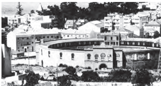
Figura 8 – A Praça de Touros de Algés, nos anos 1950.

No verão de 1896 foi inaugurado em Algés o velódromo D. Carlos 40 (Figura 9). Aquele espaço de diversão destinado à prática de provas de velocípedes, com o seu rústico coreto para ali tocar a banda 41 , era o segundo do país, medindo a sua pista, de macadam , 500 metros 42 . Este inovador espaço para a prática do desporto velocipédico, tinha capacidade para algumas centenas de assistentes distribuídos por tribunas e galerias 43 .