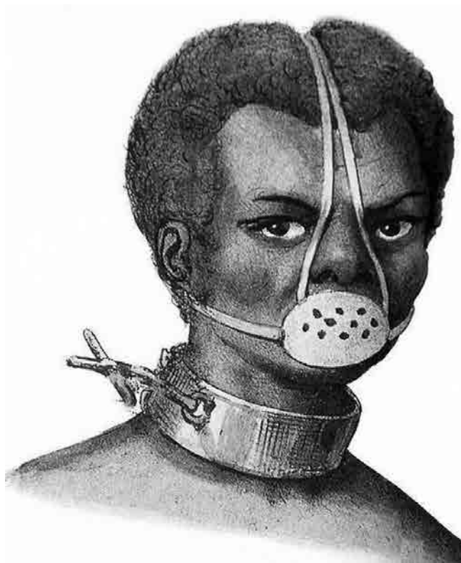
Figura 3 · Jacques Etienne Arago. Castigo de Escravos , 1839. Litografia aquarelada sobre papel. Coleção Museu AfroBrasil.