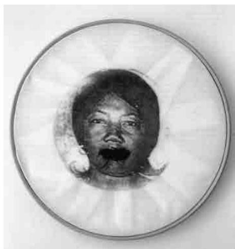
Figura 1 · Rosana Paulino. Bastidores , 1997. Imagem transferida, bastidor de madeira, tecido, linha de costura.