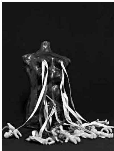
Figura 4 - Rosana Paulino. Ainda a lamentar , 2011. Cerâmica fria, cordão, madeira, plástico e metal.