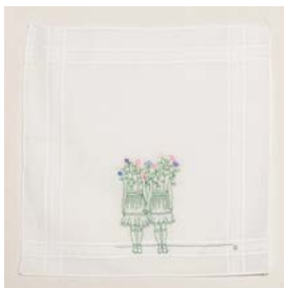
Figura 7 · Rick Rodrigues, Tudo o que não invento é falso , 2016.

Escadinha de madeira jacarandá e cama miniatura, dimensões variáveis.