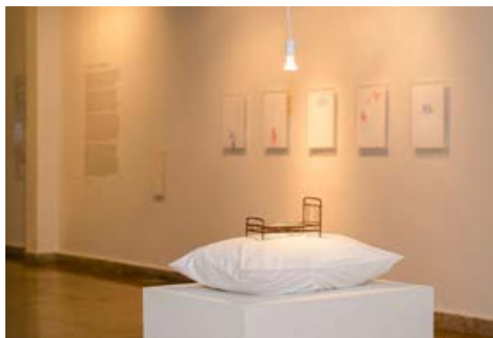
Figura 1 · Foto geral da exposição Tudo que não invento é falso , de Rick Rodrigues, 2016, Galeria Homero Massena, Vitória/ES-Brasil. Fonte: https://www.rickrodrigues.com/

Figura 2 · Rick Rodrigues, Sem título, 2016. Fronha bordada, travesseiro, miniatura de cama e lâmpada suspensa. Instalação. dimensões variáveis. Exposição Tudo o que não invento é falso , 2016, Galeria Homero Massena, Vitória/ES-Brasil. Fonte: https://www.rickrodrigues.com/