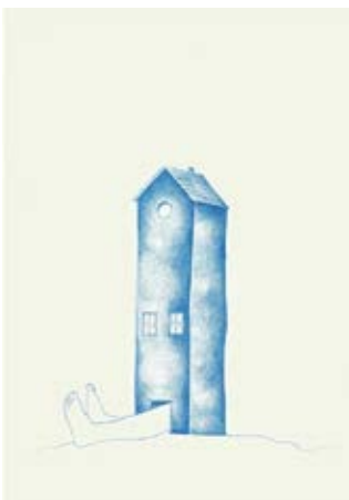
Figura 3 - Rick Rodrigues, Tudo o que não invento é falso , 2016. Grafites coloridos para lapiseira 0,5 mm sobre papel creme, 21x15cm (cada). Fonte: https://www.rickrodrigues.com/

Figura 4 - Rick Rodrigues, Tudo o que não invento é falso , 2016. Grafites coloridos para lapiseira 0,5 mm sobre papel creme, 21x15cm (cada). Fonte: https://www.rickrodrigues.com/