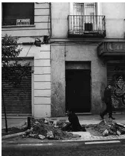
Figura 1 · Carlos Rodríguez-Méndez, "Construir procesos XV". Plaza de Castilla, Madrid, 2004. Fotograma del vídeo. Fuente: artista.