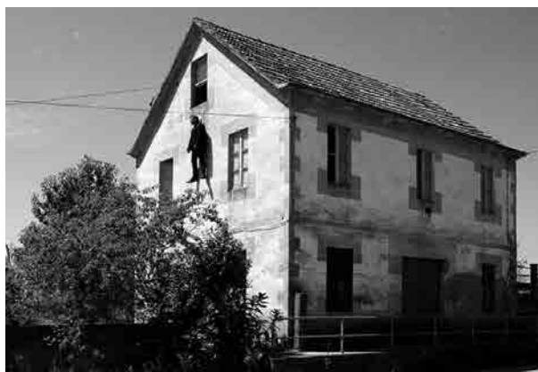
Figura 3 · Carlos Rodríguez-Méndez, "Fontiña nº 7". As Neves, Pontevedra, 2003. Intervención en la casa familiar antes de que fuera derribada.