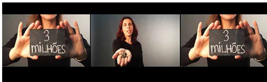
Figura 7 · Instalação — Apresentação final de projetos.