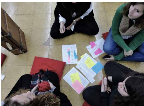
Figura 5 · Processos desenvolvidos no âmbito da música.