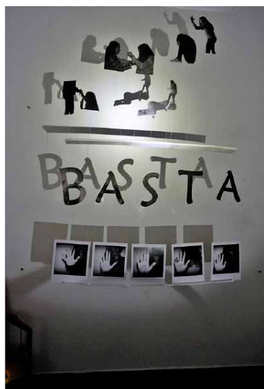
Figura 9 · Instalação-apresentação final de projetos.