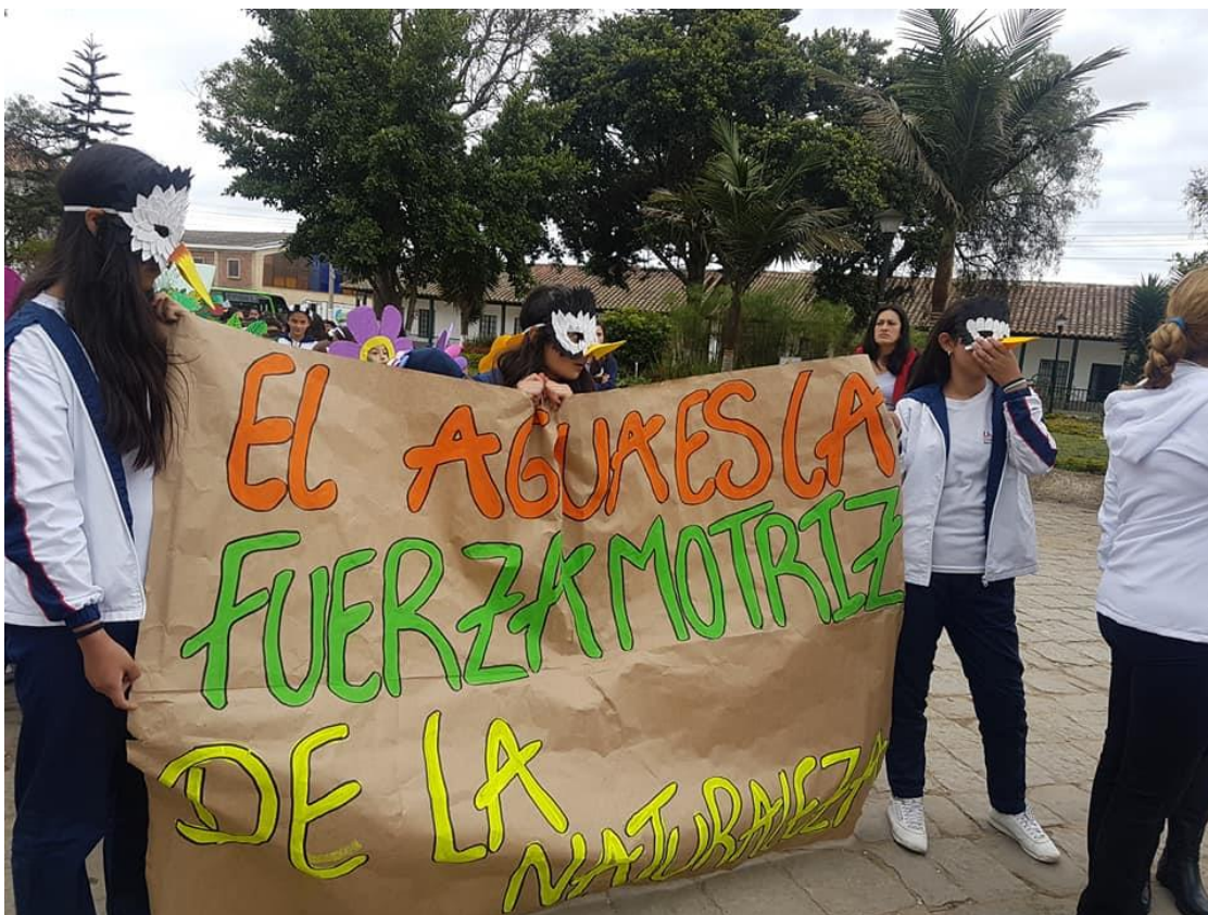
Imagen 11: Pancarta de alumnas del Liceo Moderno Isaac Newton durante la comparsa realizada en el marco del Carnaval.

el evento central de esta edición fue realizado en la vereda de Puente Piedra (las 2 anteriores ediciones fueron realizadas en la zona urbana) posibilitando un acercamiento de la población rural madrileña a estas dinámicas.