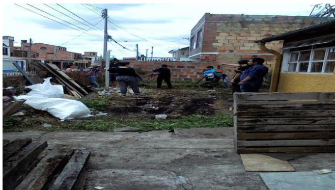
Imagen 12: Algunos integrantes de La Semilla están adecuando la huerta en su sede en una jornada de minga En el 2016.

Desde el trabajo etnográfico se detectó que una de las intenciones de la Semilla con esta actividad es acercar a los asistentes del Carnaval a su sede, ubicada en la zona urbana, en la que lideran procesos formativos de carácter político, artístico y ambiental, cuyos asistentes en su mayoría hemos sido integrantes de la plataforma. Además, en la sede también se encuentra una huerta agroecológica, financiada en parte por el banco de iniciativas de la Gobernación de Cundinamarca al que esta organización pudo ganar en la convocatoria de proyectos que se hace anualmente en Cundinamarca. Semilla pudo participar al ser una organización muy activa de Jóvenes Visibles 39 . Esto puede explicar el apoyo institucional que tuvo la Semilla para la realización del carnaval en el 2018.