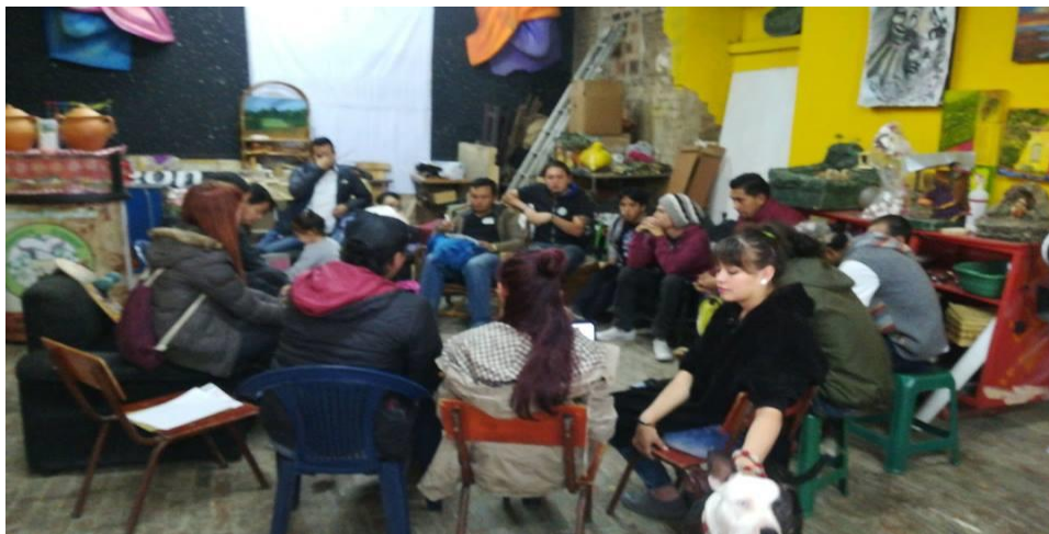
Imagen 7: Reunión General de Plataforma de Juventudes sobre plan de trabajo en la sede de Arte Madrid