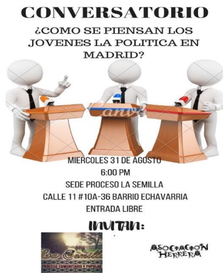
Imagen 3: Flyer sobre Convocatoria al grupo focal (Elaboración propia, 2016).

Aprovechando los buenos lazos generados con los integrantes de las organizaciones, les propuse la elaboración de un grupo focal sobre política y juventud en el municipio que planteaba las siguientes interrogantes: ¿Qué es para usted la política? ¿Cómo se da la política en Madrid? ¿Cuál es el papel de las Juventudes en la práctica política de Madrid?