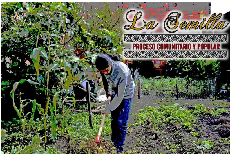
Imagen 4: Logo del Proceso La Semilla junto con uno de sus integrantes trabajando la huerta ubicada en su sede.

¿Por qué se llama Semilla? David señala el significado del nombre en un sentido metafórico, sobre la posibilidad de crecer y germinar de las mismas formas que hace una semilla. También cita como fuente un poema de Roque Dalton como alegoría a la lucha social 13 .