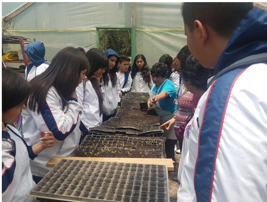
Imagen 15: Integrantes de la Asociación Herrera explican a alumnos de Bachillerato el proceso de cultivo en su huerta en una actividad realizada en el 2017.

Aunque gran parte de la elaboración de estas actividades se ha hecho mediante la autogestión, hay que mencionar las articulaciones que hace la Herrera para fortalecer su trabajo con otros procesos del territorio como ASOQUIMAD (Asociación de campesina de Madrid), Red Popular de Mujeres de La Sabana, Corporación Cactus (organización de varios profesionales de la Sabana de Bogotá que trabajan temas ligados a la floricultura) y la comunidad de la vereda Los Árboles. La ausencia de las compañeras que están en otros países puede ser una posibilidad para conseguir apoyo o explorar nuevos horizontes políticos.