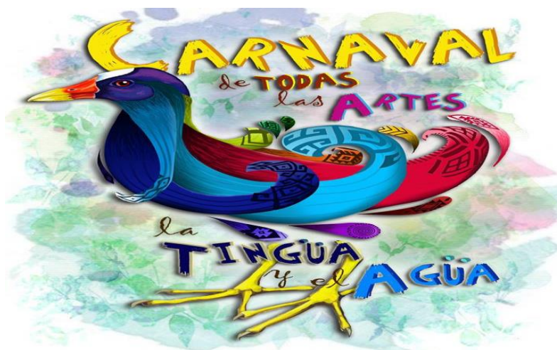
Imagen 9: Flyer del Carnaval de Todas las Artes del 2018. La imagen es la de una Tingua, ave endémica del municipio. Tomado del Facebook de la Semilla (2018).

El Carnaval de Todas Las Artes es un espacio de reflexión sobre las problemáticas ambientales del municipio como la contaminación, producto de las actividades floricultoras, de mega minería, urbanización y otros megaproyectos en el marco de Ciudad Región. También es un espacio para la reivindicación de espacios hídricos como una forma de fortalecer la identidad la población madrileña. Tal como se expresa en el nombre de la actividad se eligen las prácticas culturales y artísticas como forma para trabajar estas dinámicas.