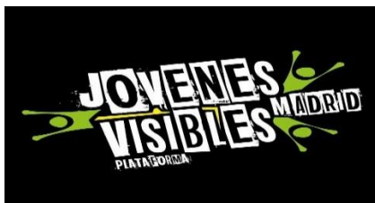
Imagen 6: Logo de Jóvenes Visibles.

La plataforma de juventudes de Madrid se llama Jóvenes Visibles , adoptado del nombre del programa de juventud de la alcaldía “Jóvenes Más Visibles”. La plataforma se conformó mediante la resolución 024/2016 del 27 de octubre de 2016, agrupando 15 iniciativas juveniles del municipio 24 . Las reuniones se realizan una vez al mes. Si una organización no asiste a tres reuniones seguidas es expulsada de la plataforma. Por otro lado, si una organización nueva quiere hacer parte, debe ir a tres reuniones seguidas.