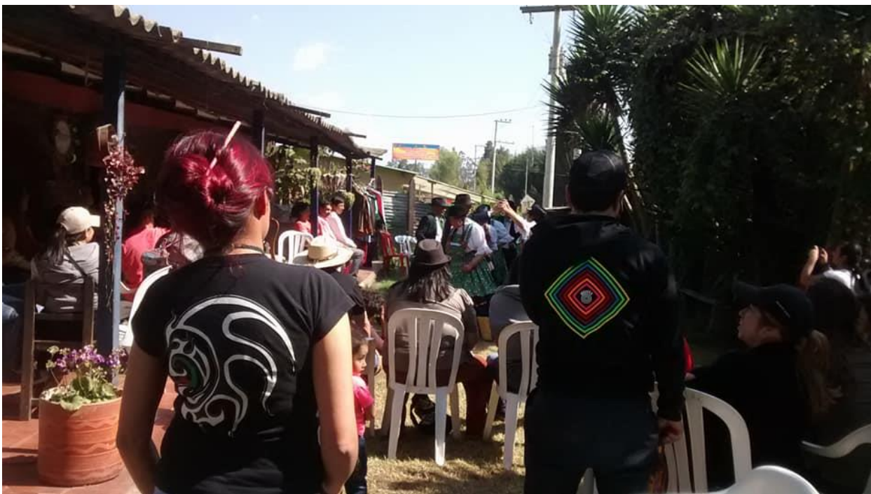
Imagen 14: Presentación artística de una danza andina en el Encuentro Urbano-Rural del 17 de diciembre de 2017.

Después de varios años trabajando en la ruralidad, la reciente entrevista a Geraldine pudo mostrar un pequeño balance de estas experiencias de trabajo político: