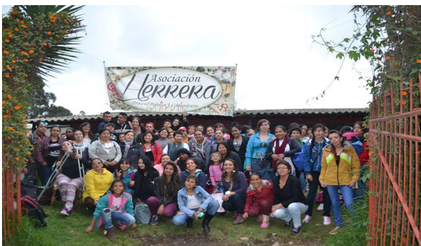
Imagen 5: Logo de la Asociación Herrera en la sede de la organización en la vereda Los Árboles junto con habitantes de dicha vereda.