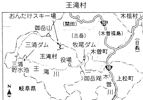
(出所)「信濃毎日新聞」2006年1月15日付。

その後、家高という人が野沢温泉村から、スキーのできる人で、この方が村長になるんです。その人が村長になるのは1975年です。スキーがうまくいっている段階なんです。そして、スキーが赤字になったところに、もちろんその間に15億円ぐらいお金をためておいてたので立派だと思っんですが、99年にやめるんですね。赤字が1億円出た段階で。