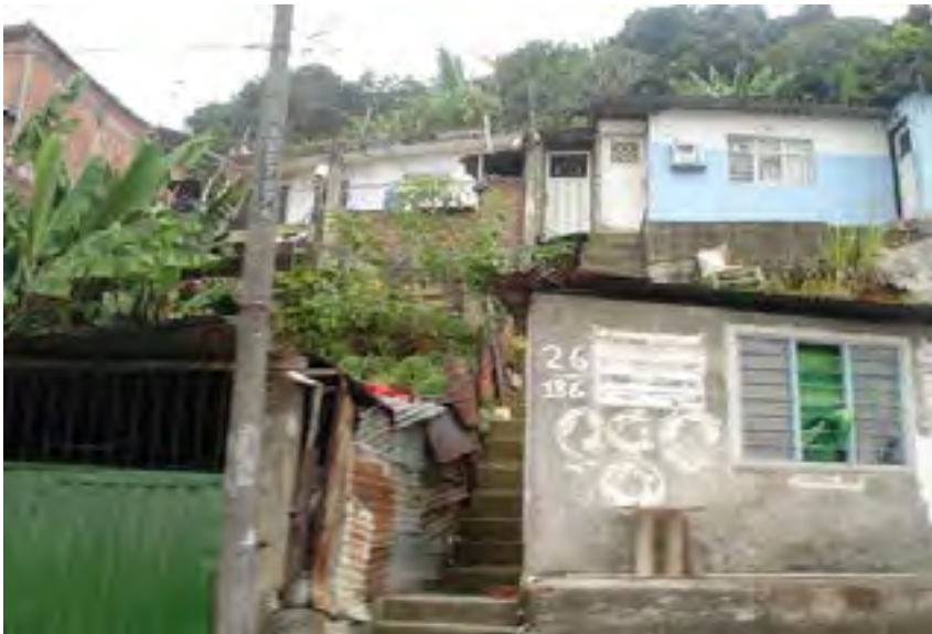
Fotografía 1. Topografía barrio Terrón Colorado

Fuente: http://farm3.static.flickr.com/2131/2537197498_19e5c0017d.jpg?v=0 Capturada, julio de 2009