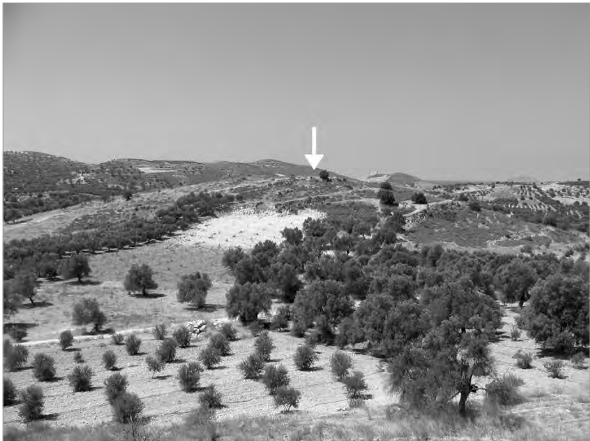
I.2. Veduta della collina di Grigori Koryphi con l'indicazione della Tholos A dal costone roccioso a N ospitante la Tholos B .