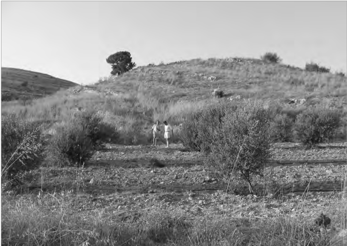
I.3. Veduta della collina di Grigori Koryphì da E.

come è noto, a partire dall'epoca protopalaziale l'uso delle tombe a tholos si eclissa lentamente 8 . Le rioccupazioni dell'area in epoca storica, in particolare i reperti provenienti dalla Tholos A e la stipe votiva di statuine fittili di epoca storica nella Tholos C , siglano ulteriormente l'importanza che l'area svolse nei secoli come luogo funerario dall'epoca minoica fino alla costituzione della provincia romana di Creta (67 a.C.).