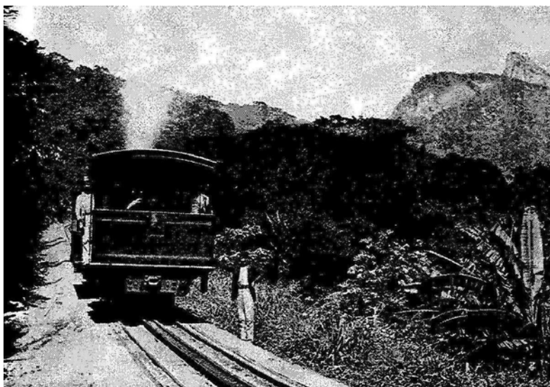
Imagem 3. Ferrovia do Corcovado

Outra característica, representada também na imagem que segue, a qual é inserida pelo próprio autor, em sua obra de divulgação, refere-se à vitória sobre a natureza, representada pelo avanço da ferrovia, no Corcovado, em forma de cremalheira. Ao destacar que tal obra – a cremalheira – construída pelo prefeito fluminense há muitos anos, é um sinal de sua audácia e talento, Buccelli reforça sua concepção de um poder público corajoso que está conduzindo a ferro e fogo a cidade à modernidade. Ela chega também com o vapor e permite conquistar este espaço de beleza incomparável, que permite uma vista panorâmica de toda a urbs , que é o cume do morro do Corcovado. Como se identifica emblematicamente na imagem selecionada por Vittorio Buccelli, a modernidade pode ser representada como um trem que vai penetrando na floresta, produzindo fragmentos imagéticos do progresso da tecnologia.