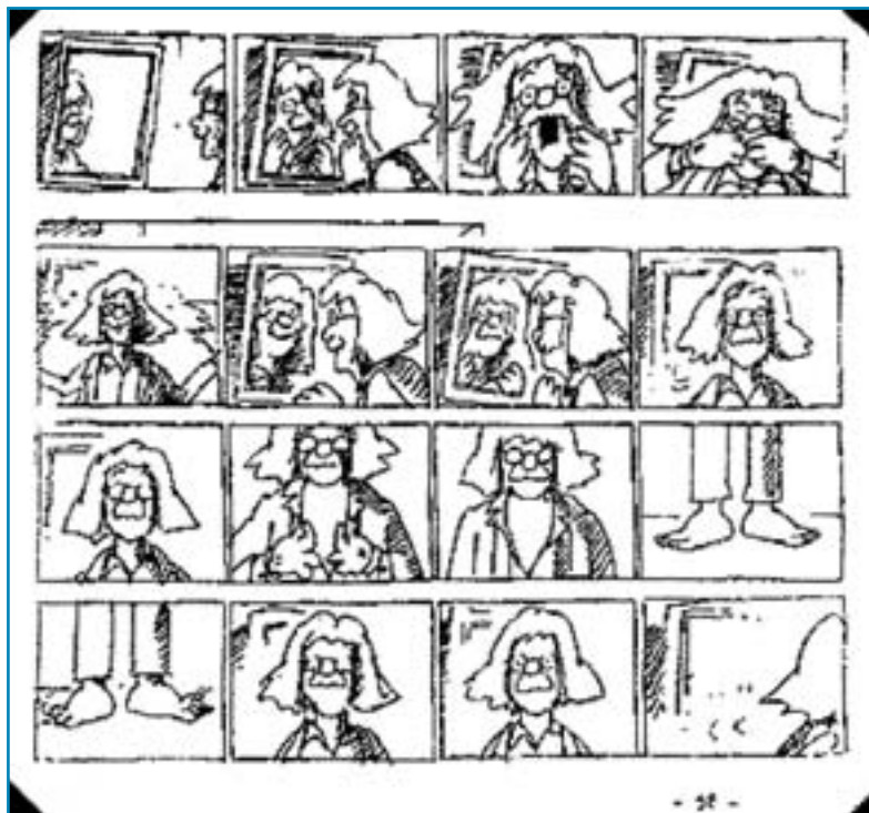
figura 3 in alto

Facciamo ora una riflessione: rileggendo con attenzione queste ultime indicazioni non vi sembra di essere proiettati nel disegno delle strisce di un fumetto? (figure 3-4)