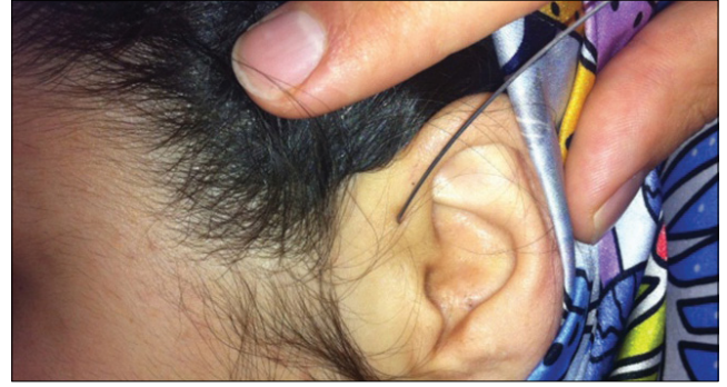
Şekil 2. Preaurikuler sinus (Sol taraf).