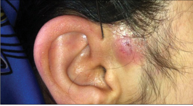
Şekil 1. Preaurikuler sinus (Sağ taraf).