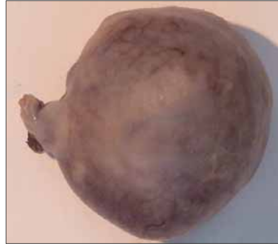
Şekil 1B. Mikroskopik değerlendirmede hemotoksilen eosin ile boyamada konjesyon gösterilmiştir.

lümde serbest sıvı, umblikus lateralinde, sağ orta klaviküler hatta, uterus miyometrium komşuluğunda transvers planda 39*28 mm boyutlarında, düzenli konturlu yuvarlak şekilli kitle lezyon izlendi. Sağ alt kadranda appendisit ekarte edilemedi. Transvajinal ultrasonografide, serviks 38 mm uzunlukta ölçüldü, her iki overin normal boyut ve yapıda olduğu tespit edildi. Akut batın tanısı ile eksploratif laparotomi uygulandı. Genel anestezi altında, Rockey-Davis insizyon ile batına girildi. Eksplorasyonda sağ parakolik alanda minimal sıvı saptandı. Sağ over ve tubanın, retroçekal yerleşimli apendiksini normal olduğu görüldü. Sağ paraumbikal bölgede üzeri omentumla örtülmüş, uterus korpusundan kaynaklanan, kendi pedikülü çevresinde dönerek strangüle olmuş, 3x4 cm boyutunda, mor renkli, subserozal miyom izlendi (Şekil 1A). Miyomektomi uygulandı. Patolojik incelemede ağır venöz dolaşım yetersizliğine neden olmuş akut torsiyone leiomyom bulguları tespit edildi (Şekil 1B). Post operatif dönemde ve olgunun antenatal izleminde gebelik normal seyrinde takip edildi.