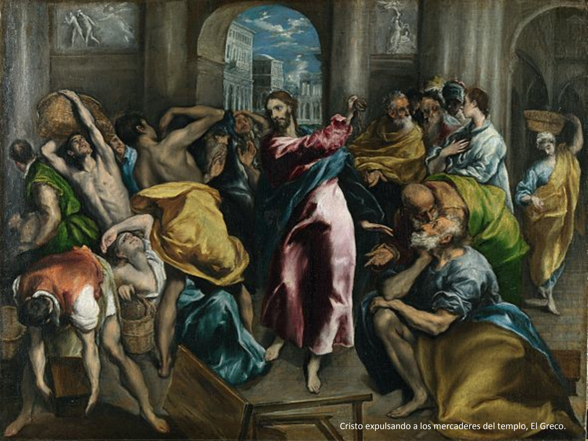
Cristo expulsando a los mercaderes del templo, El Greco.