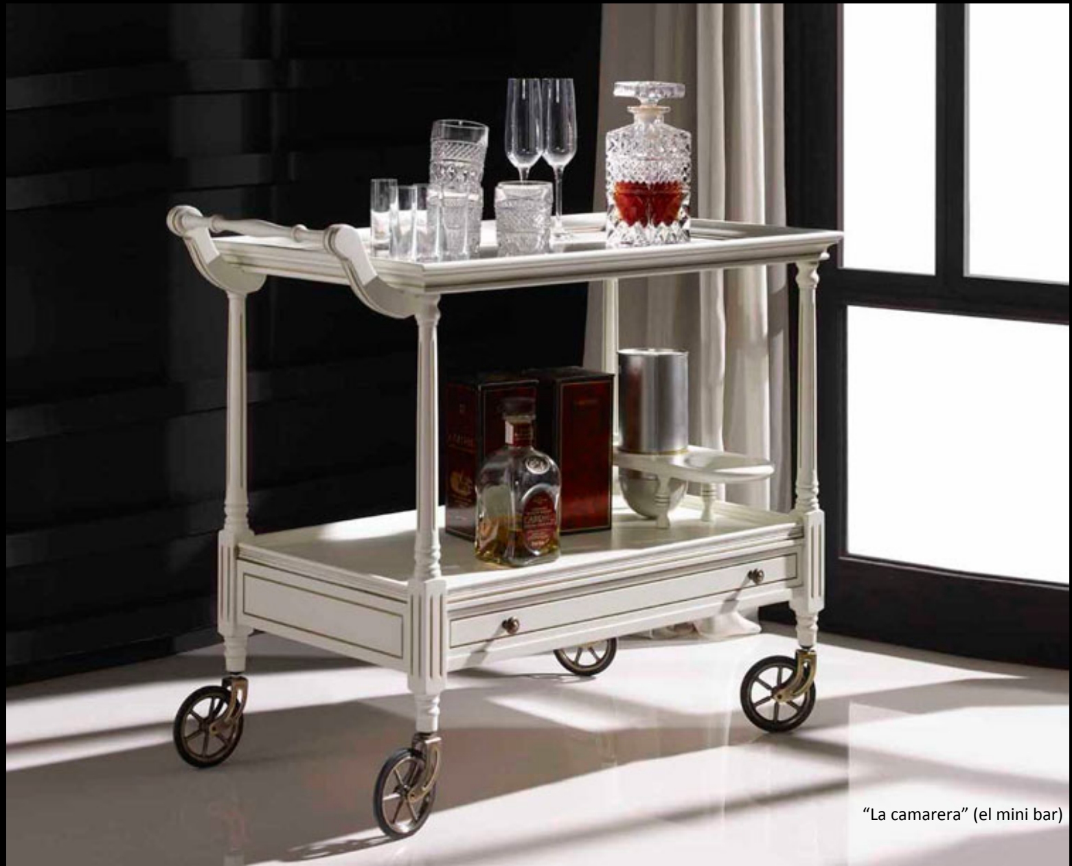
“La camarera” (el mini bar)