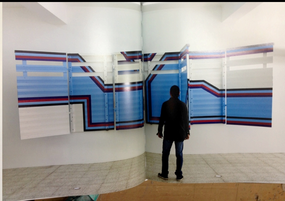
"Geometric Construction" #2