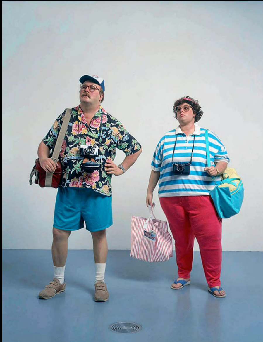
Tourist II (1977).