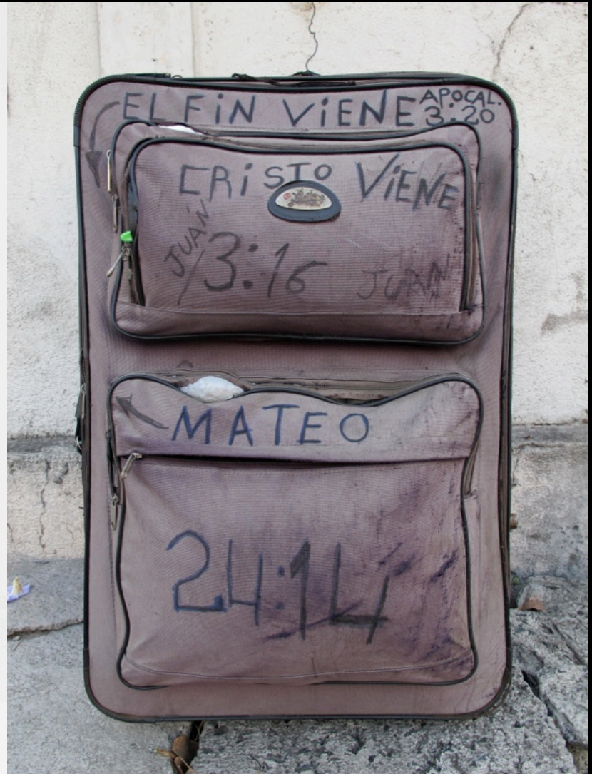
Wim Delvoye, Carry-on. (derecha) foto de la serie Imaginarios Urbanos en San Salvador 2010.