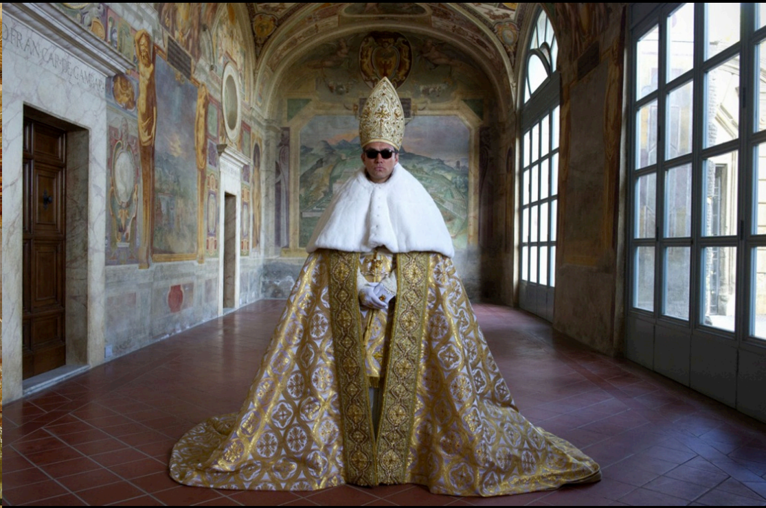
Jude Law (Actor)