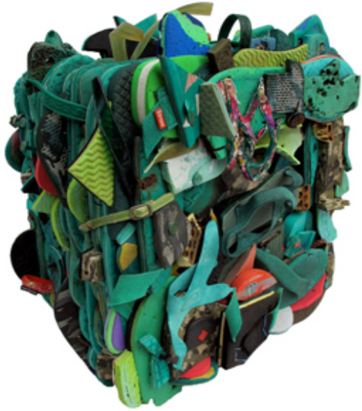
“Acumulación Verde #12”