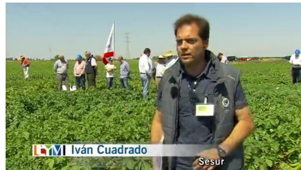
Imagen 4. En la transmisión del día 26 de mayo de 2013 se habló del cultivo de la patata y las variedades que existen en Andalucía, junto con políticas para la conservación de estos cultivos, amenazados por la llegada de patata extranjera.

La descripción de lo que se realiza dentro del sector primario pero de una forma sostenible y amigable con el medio ambiente, es la táctica que se utiliza para lograr que el público muestre interés, pero que al mismo tiempo adquiera conciencia hacia la protección y el cuidado del medio ambiente, porque de su equilibrio depende el consumo de productos sanos y de calidad (Ver imagen 4).