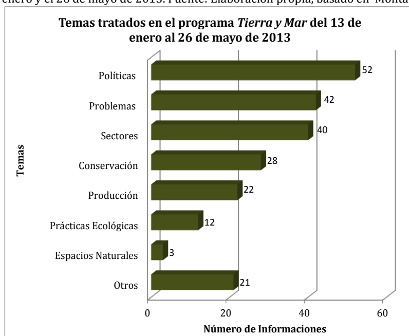
Gráfico No. 2 Número de Informaciones y temas tratados en la programación comprendida entre el 13 de enero y el 26 de mayo de 2013.

Durante la observación, se ha realizado un listado de los principales temas abordados en los 20 programas y se ha hecho un conteo del número de ocasiones que apareció cada tema. En un reportaje pueden aparecer uno, dos o más temas, por lo que se ha hecho el conteo a cada uno de ellos. Después de la observación y el conteo de los temas, se realizó un gráfico basado en la clasificación que hace Montaña (1998), se ha hecho una adaptación de acuerdo con el análisis. El resultado es el siguiente: