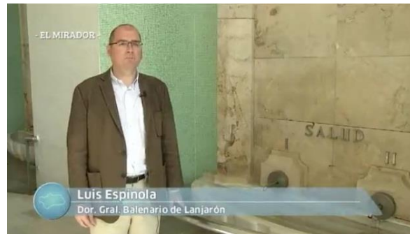
Imagen 2. En la transmisión del 18 de mayo de 2013, se habló del Balneario de Lanjarón para promover el turismo sostenible y al mismo tiempo se mostró el espacio natural que hay en el entorno y estudios relacionados con el agua de manantial que nace en la zona.

Durante la transmisión del programa, se brinda una exposición de diferentes temas de actualidad y un contexto general de la situación a nivel local. Son contenidos relacionados con el medio ambiente, que proporcionan la información suficiente para que el público adquiera conocimientos sobre flora, fauna, recursos naturales, etc. y