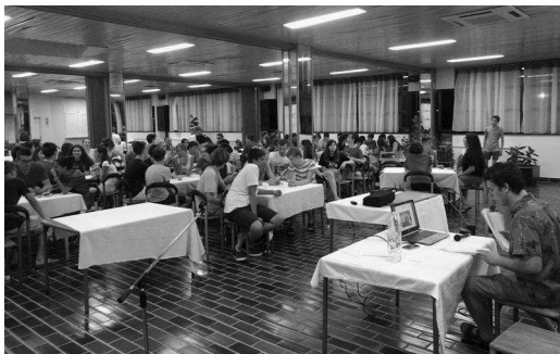
Slika 5. S matematičko-nematematičkog pub-kviza.

Bez obzira na gust raspored aktivnosti, ostalo nam je dovoljno vremena za zabavu. Budući da je i ovaj Ljetni kamp bio na moru, iskoristili smo mnoge slobodne trenutke za kupanje, ronjenje i picigin, ali nismo zaboravili odigrati i nekoliko košarkaških utakmica. U učeničkom domu dobro smo se zabavili igrajući stolni tenis, belu i trešet, a nekoliko večeri proveli smo uz nezaboravne karaoke i gitaru. Jednu smo večer već tradicionalno proveli igrajući pub kviz, a pobjedu je, iako tijesnu, odnio tim Palekina IMO karijera , osvojivši pritom vječnu slavu i kutiju domaćica. Ostale smo večeri uglavnom proveli igrajući “Mafiju” i družeći se.