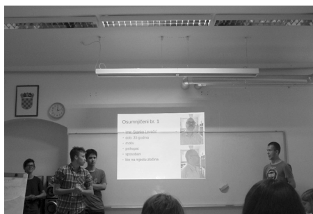
Slika 5. Detektivi prezentiraju svoje zaključke.