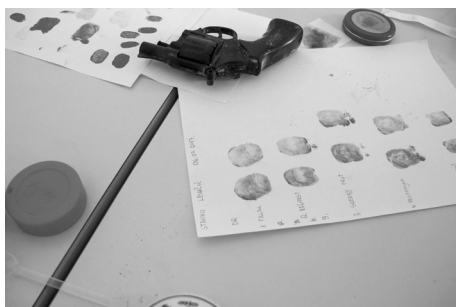
Slika 4. Uzimanje otisaka prstiju s pištolja.

Tijekom srijede i četvrtka timovi su radili na obradi prikupljenih dokaznih materijala koje su potom prosljeđivali detektivima, a glavni inspektor je vodio računa da se sve odvija prema protokolu. U petak je svaki od timova prezentirao svoje aktivnosti i zaključke, a tim detektiva je na kraju izložio sve prikupljene dokaze i otkrio tko je od troje osumnjičenih krivac.