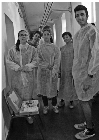
Slika 1. Spremni za odlazak na mjesto zločina.

Ljetna škola Pete svoj je put započela kao ljetna škola matematike sa željom da polaznici osvijeste gdje se sve i kako primjenjuje matematika u svakodnevnom životu. S godinama smo sve više uključivali ostale prirodoslovne predmete, a osluškajući želje i interese naših polaznika odlučili smo ovogodišnju ljetnu školu posvetiti forenzici. Na to nas je ponukala i prošlogodišnja suradnja s Centrom za forenzična ispitivanja, istraživanja i vještačenja “Ivan Vučetić”. Tema je iznimno aktualna i zanimljiva svim uzrastima te omogućuje brojna istraživanja iz kemije, biologije, matematike, fizike i informatike, što nam je i bio cilj. Posebno smo obratili pažnju na zablude i miskonceptije koje učenici mogu steći gledajući brojne serije s temom forenzike i istraživanja mjesta zločina.