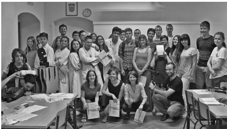
Slika 6. Zajednička fotografija polaznika i njihovih mentora.