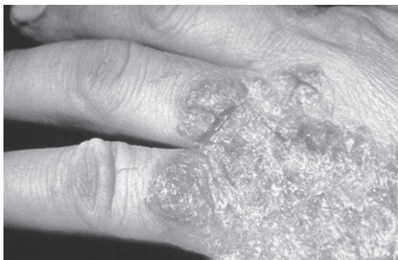
Slika 1. Dermatitis uzrokovan tekućinom za obradu metala Figure 1. Dermatitis caused by metalworking fluid

Procjena je da troškovi povezani s tekućinama za obradu metala iznose približno 16 % ukupnih troškova proizvodnje, dok kod obrade teško obradivih materijala oni dostižu 20-30 % (Pušavec i sur., 2010.). To je mnogo više od troškova alata koji iznose približno 2-4 % ukupnih troškova proizvodnje. Troškovi povezani s tekućinama za obradu metala nisu ograničeni samo na njihovu nabavu i pripremu, već uključuju i troškove održavanja te zbrinjavanja. Troškovi zbrinjavanja otpadnih tekućina za obradu metala mogu biti i preko četiri puta veći od njihove nabavne cijene, uglavnom, zbog činjenice da većina tekućina za obradu metala nije prirodno biorazgradiva, što onda zahtijeva poseban (skupi) tretman (Hong i Zhao, 1999.).