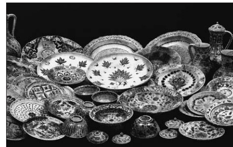
MLJET, BRODOLOM U PLIČINI SV. PAVAO: OSMANSKA IZNIK KERAMIKA, 16. ST. MLJET, SHIPWRECK ON ST PAUL'S SHOAL: OTTOMAN IZNIK CERAMICS, 16 TH CENTURY