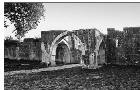
VRANA, MAŠKOVICA-HAN: PAVILJON ŠADRVA I MUSALLA VRANA, MAŠKOVICA-HAN: PAVILION (ŠADRVA AND MUSALLA