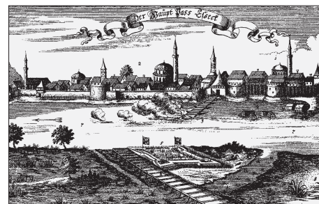
OSIJEK: VEDUTA OSMANSKOG SEHERA, 1687. OSIJEK: VIEW OF THE OTTOMAN TOWN, 1687

Uz usko znanstvenu aktualizaciju naslijeđa islamske kulture ovo djelo paralelno potiče i njegovu širu javnu revalorizaciju, kroz koju će se ono promatrati objektivnije i ravnopravnije s ostalim stilskim slojevima hrvatske baštine. Time će se i edukacijski, konzervatorski, muzeološki i medijski tretman islamskih spomenika višestruko unaprijediti, nadilazeći ranija ograničenja uvjetovana neistraženošću, neznanjem, a nerijetko i nekritičkim predrasudama.