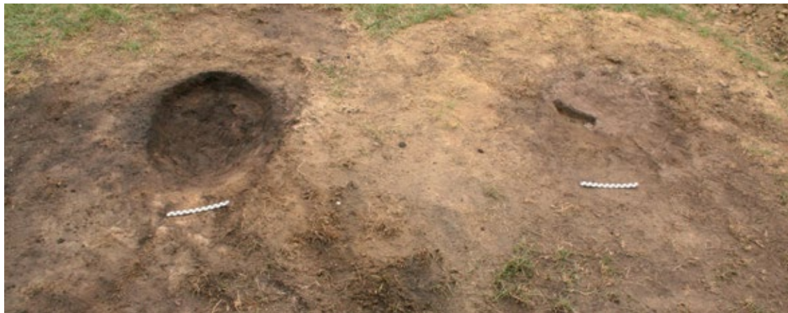
Slika 7: Ostaci plitkih jamica na mjestima peći

se temperatura je iznosila 1388°C. 51 Tijekom procesa taljenja izuzetno je bitno provjeravati što se u peći događa. 52 Razloga tome je moguće nakupljanje tekuće zgure na sapnici i njeno djelomično začepljenje tijekom ubacivanja smjese rude i ugljena, koje tada onemogućuje danji proces i taljenje postaje neuspješno. 53 U tom segmentu bitnu ulogu igra upuhivanje zraka kroz sapnicu koje, ako je rađeno pravilno, ne dozvoljava ovu pojavu. S druge strane, znak da je proces taljenja pri kraju upravo je nakupljanje tekuće zgure na sapnici. Uz održavanje temperature, u samostojećoj je peći, kakve su nalažene na prostoru Podravine i kakve su izrađivane na Renesansnom festivalu, bitno kompenzirati gubitak topline koji se događa kroz stijenke. Kod peći koje su gotovo u potpunosti ukopane u padinu, poput onih izrađivanih na radionici u Češkoj, 54 gubitak temperature kroz stijenke je nezamjetan budući da su one s tri strane okružene padinom. U slučaju samostojećih peći potrebno je stoga kompenzirati gubitak topline nasipavanjem zemlje na vanjsku stijenku peći, kao što je to bio slučaj s drugom peći. 55