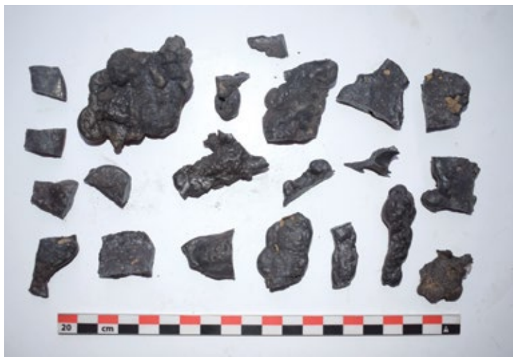
Slika 9: Komadi talioničke zgure koji nastaju ispuštanjem zgure iz peći