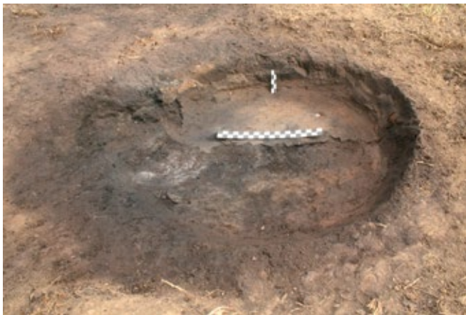
Slika 5: Presjek dna Peći 1

Prilikom taljenja željezne rude odlučeno je da će se u obje peći ubaciti 13 kg rude. Punjenje peći rudom i drvenim ugljenom odvijalo se u omjeru 1:1 i to na način da se ubacivalo \frac{1}{2} kg ugljena 48 na \frac{1}{2} kg rude. 49 Prilikom punjenja peći važno je da je ona kontinuirano do vrha zapunjena te da se zrak u peć upuhuje u ravnomjernih intervalima. 50 Početak taljenja Peći 1 bio je u 14 sati, a s ubacivanjem rude se završilo u 17 sati. Proces ubacivanja rude kod druge peći trajao je nešto dulje, u razdoblju od 15:00 do 19:20 sati. Prilikom taljenja u drugoj peći, nakon otprilike jednog sata, i ubačene mješavine ugljena i rude težine do 6 kg temperatura u peći iznosila je 1335°C (izmjereno kroz sapnicu). Pola sata kasnije, nakon ubačenih 9 kg smje-