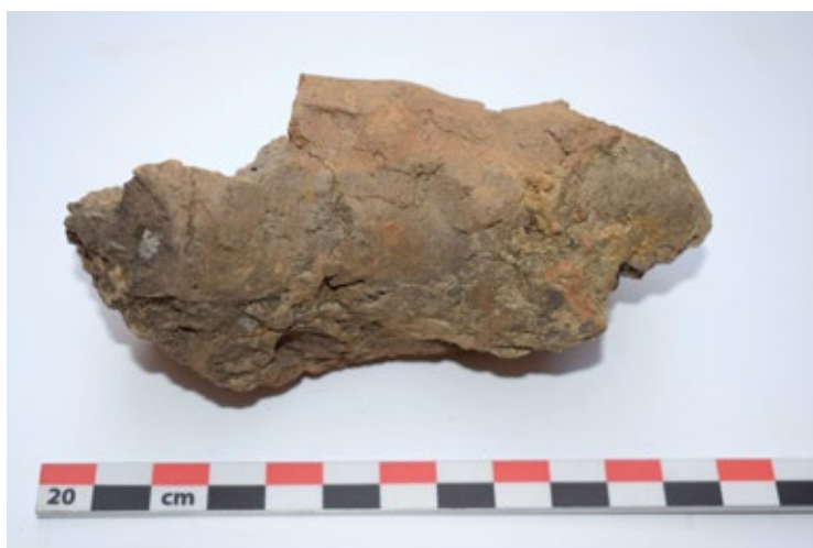
Slika 10a: Valjkasti glineni segmenti s tragovima prstiju iz Peći 1

ste zgure koja se tijekom procesa taljenja nakupila uz stijenku i na dnu ložišta. U središnjem je djelu ložišta bilo vidljivo mjesto na kojem se taložilo željezo (Slika 3). Ispred ložišta druge peći nisu zamijećeni ostaci zgure koja je ispuštena kroz otvor pri dnu vratiju no zamijećeni su ostaci tzv. čipkaste zgure na dnu ložišta i mjesto gdje se taložio i stvarao grumen željeza (Slika 4).