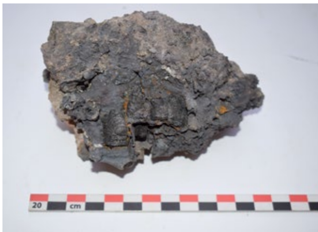
Slika 11: Ulomak troske sa neizgorenim komadićima ugljena iz Peći 1

Razmatrajući proces taljenja željezne rude, predradnje koje mu prethode te poteškoće koje tijekom njegova provođenja nastaju omogućuje nam da shvatimo složenost cjelokupnog postupka. Uočljivo je kako je za uspješno taljenje potrebno značajno iskustvo budući da tijekom cjelokupnog procesa, od izgradnje peći do oblikovanja blooma , može doći do brojnih poteškoća. S obzirom na veliki broj poznatih arheoloških lokaliteta na kojima je zabilježena talionička djelatnost očito je da je, zbog prirodnih mogućnosti, taljenje željezne rude bila izuzetno značajna gospodarska djelatnost na prostoru Podravine u razdoblju od kasne antike do kraja kasnog srednjeg vijeka. S obzirom na navedene činjenice može se pretpostaviti da se vještina taljenja prenosila kroz generacije.