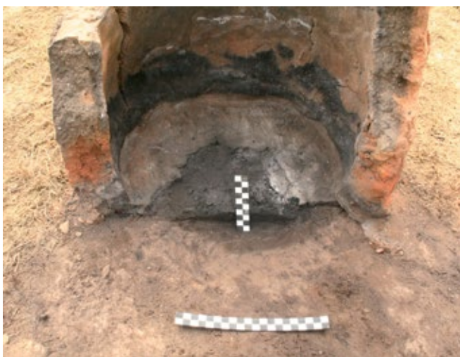
Slika 6: Presjek dna druge peći