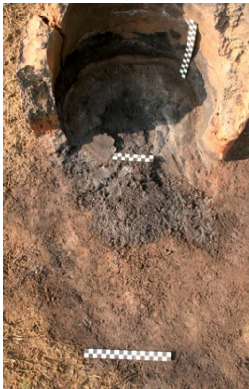
Slika 4: Dno ložišta druge peći nakon uklanjanja gara

U trenutku kada je peć u potpunosti suha postepeno se počinje zagrijavati drvenim ugljenom. 42 U tom se trenutku u peć neprestano počinje upuhivati zrak mijehom 43 kako bi se u nju dovela dovoljna količina kisika. 44 Ciljana temperatura bila je oko 1400°C. Kad je u pitanju zagrijavanje peći, ne postoji vremenski okvir koliko je vremena potrebno da bi se peć zagrijala do temperature taljenja. 45 Svaka se peć ponaša drugačije, no bitno ju je zagrijavati postepeno. Ona je spremna za taljenje u trenutku kada iz nje počinju izlaziti plinovi koji su vidljivi u obliku izmaglice koja se izdiže kroz otvor. Peć 1 se zagrijavala do 14 sati (ukupno 3 sata) kada je zapo-