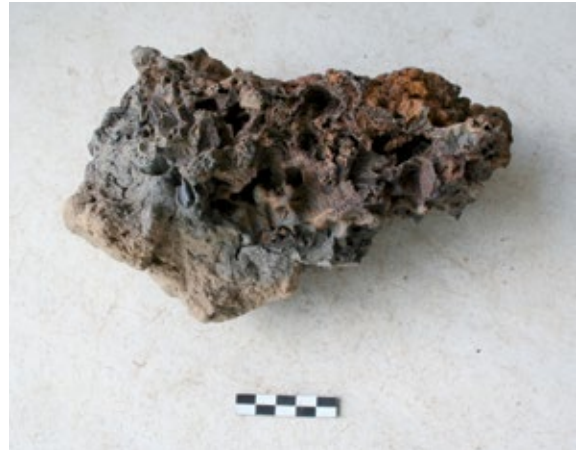
Slika 8a: Stijenka peći SJ 56 s lokaliteta Virje-Volarski breg s ostacima »čipkaste« zgure

Nakon oblikovanja i primarnog uklanjanja nečistoća spužvastog željeza iz Peći 1 njegovi su komadi nakon hlađenja prikupljeni i pohranjeni dok je veći komad iz druge peći upućen na daljnju obradu kod kovača. 60