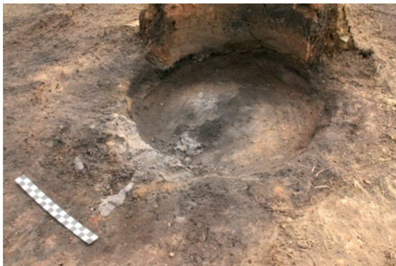
Slika 3: Dno ložišta Peći 1 s ostacima ohlađene troske na mjestu izljeva i komadićima čipkaste zgure zaostalima na dnu peći

ničke zgure iz peći. 35 »Izgradnja vrata« peći odvija se u dva navrata. Odmah pri početnom podizanju stijenki ložišta predviđa se položaj vrata i na to se mjesto stavlja veći kamen ili drveni panj oko kojeg se tada gradi konstrukcija peći. U tom trenutku taj umetak služi kao potporanj konstrukciji koja se izgrađuje do potrebne visine, a nakon završetka izgradnje čitavog ložišta on se miče, a na njegovo se mjesto tijekom postupka sušenja peći umeću vrata. Prije same ugradnje vrata, luk otvora se zaglađuje kako bi se buduća vrata, tijekom otvaranja na završetku procesa taljenja, lakše mogla odvojiti od ostale stijenke ložišta i ukloniti. Konačan proizvod procesa taljenja, spužvasto željezo, tako postaje lakše dostupno i lakše ga je izvaditi iz peći, a da se ne naruši njena struktura, kako bi se peć ponovno mogla upotrebljavati.