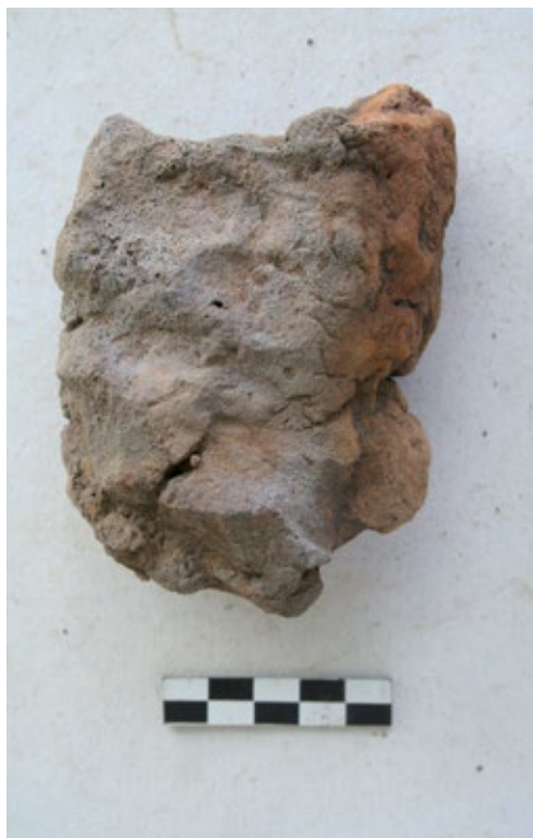
Slika 10b: Valjkasti glineni segment prikupljen iz SJ 56 s lokaliteta Virje - Volarski breg

valjkastih glinenih segmenata kojima je građena stijenka peći (Slika 10a,b). Promatrajući ulomak tzv. čipkaste zgure (Slika 8a) vidljivo je da se u njemu ne nalaze ostaci ugljena već samo prazne šupljine. Ta činjenica ukazuje da je proces taljenja u potpunosti proveden i sav je ugljen kojim je peć punjena izgorio, odnosno reduciran je. Prilikom obrade uzoraka prikupljenih na Renesansnom festivalu zamijećeno je nekoliko komada zgure u kojima su preostali nereducirani komadi ugljena (Slika 11). Iako su postupkom taljenja na Renesansnom festivalu dobiveni komadi spužvastog željeza 2 ovih nekoliko komada zgure ukazuje na činjenicu da je za potpunu finalizaciju procesa taljenja bilo potrebno još malo vremena.