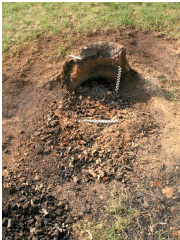
Slika 1a: Peći 1 nakon uklanjanja stijenki peći, prije početka čišćenja