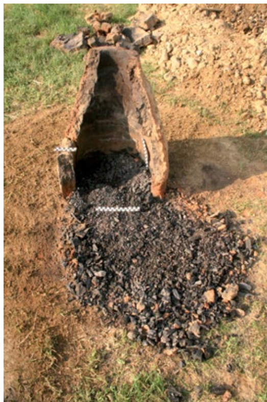
Slika 1b: Druga peć (Peć 3) nakon uklanjanja stijenki peći, prije početka čišćenja

prikupljenih znanja prezentirana je na Renesansnom festivalu u Koprivnici 2018. godine. 12 U ovom će radu biti prezentirani i analizirani rezultati i zaključci prikupljeni tijekom eksperimentalnih procesa održanih u sklopu Renesansnog festivala 2018. 13