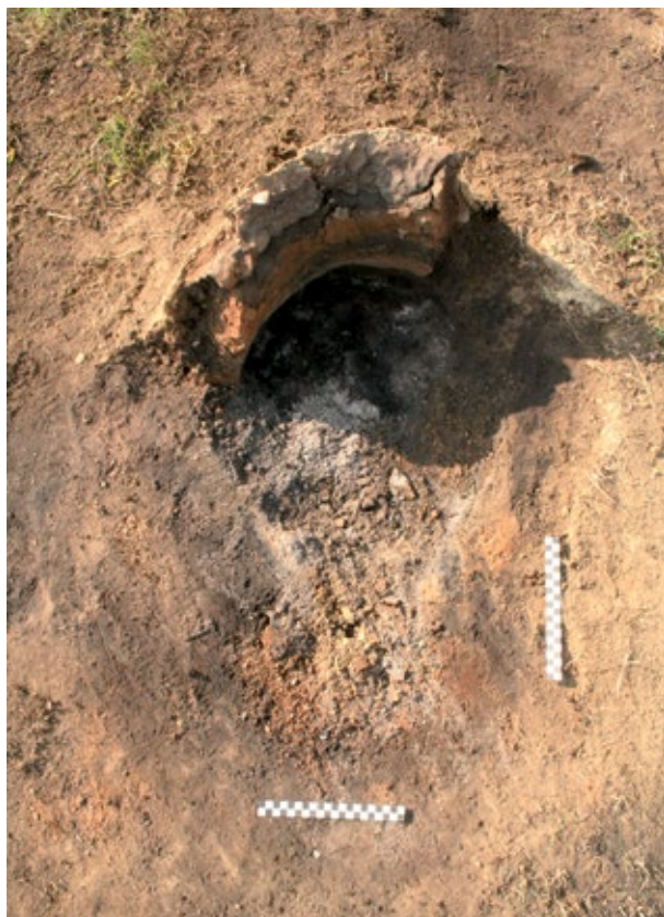
Slika 2: Ložite Peći 1 prije uklanjanja ostataka gara (snimila T. Sekelj Ivančan)

tvrdra nije ju moguće modelirati. Omjeri u smjesi pri izgradnji druge peći su korigirani te je njena širina, od dna do vrha iznosila 6 cm. 31