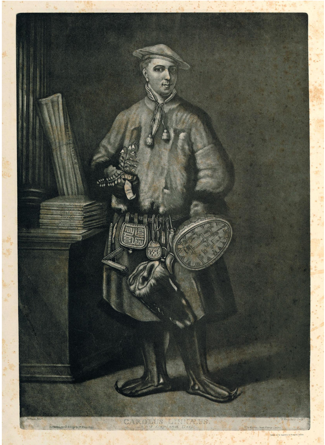
Linnaeus en su traje de lapón.