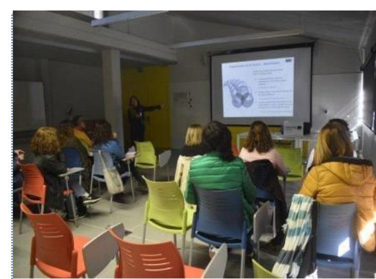
JORNADA D'AVUACIÓ D'ENQUESTES I ANÀLISI DE PÚBLIC. PROJECTE PATRIM+ (2019)