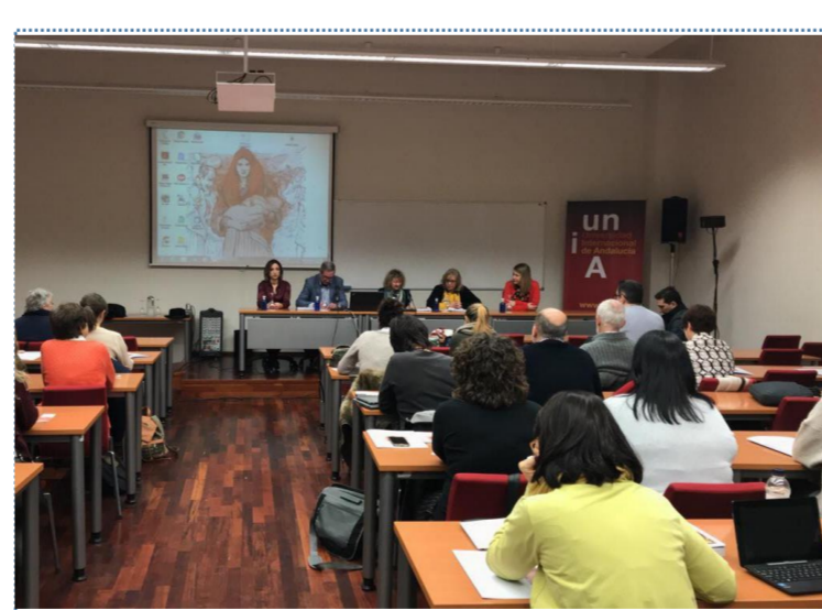
SEMINARI PATRIMONI ARQUEOLÒGIC I DONES: RE-DIBUIXANT EL PASSAT (UNIVERSITAT INTERNACIONAL D'ANDALUSIA, 2018)