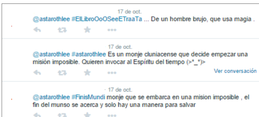
Imagen 2. Ejemplo de la actividad 2

Tras tener ellos el libro en sus manos, es decir, una vez que lo habían manipulado, tenían que escribir en Twitter un pequeño resumen con un máximo de 140 caracteres de lo que creían que tratará el libro tras haber visto la portada. Es decir, queríamos ver la capacidad de síntesis que tenían ellos.