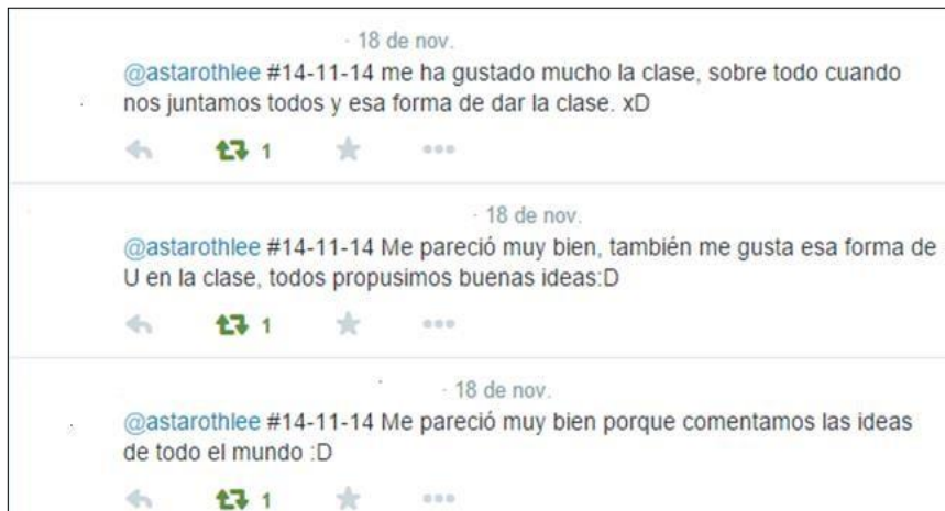
Imagen 4. Ejemplo de la actividad 4

Esta actividad se realizaba en todas las sesiones pues pretendíamos que en Twitter comentasen qué les había parecido la clase de lectura de esa semana y las actividades desarrolladas. Incluso, podían indicar algunos aspectos de mejora que se tenían en cuenta para las sesiones posteriores.