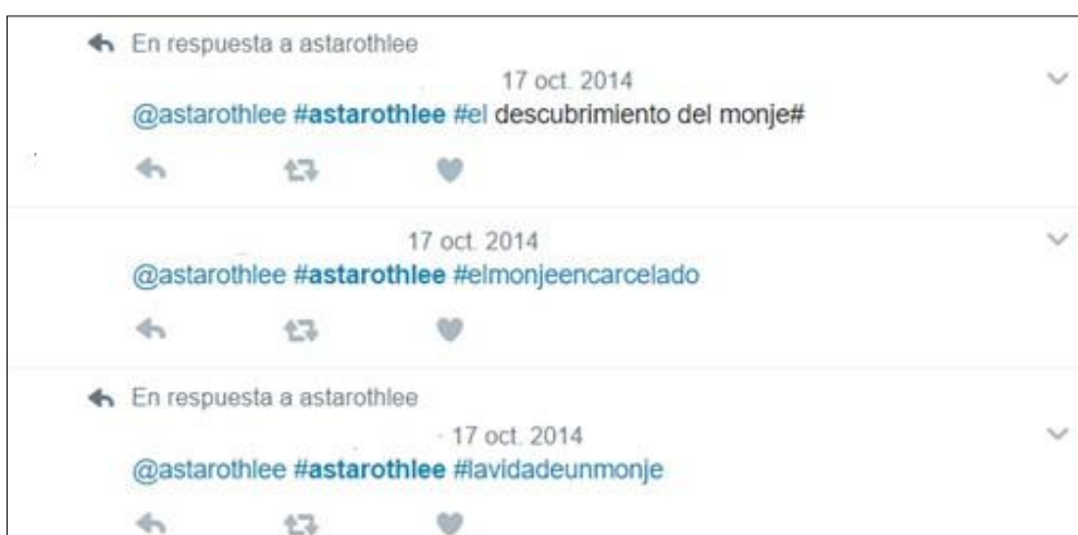
Imagen 1. Ejemplo de la actividad 1

Tras enseñarles la portada del libro sin e título, en Twitter tenían que crearle uno a través de un hashtag. Esta se hacía individual, aunque algunos alumnos no tenían una cuenta registrada en esta red social y por eso, se hicieron en pareja.