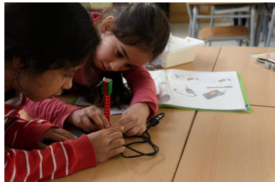
Figura 2. Alumnes a l'escola Carme August

propostes d'activitats, que guia l'aplicació de la robòtica i el pensament computacional a les aules.