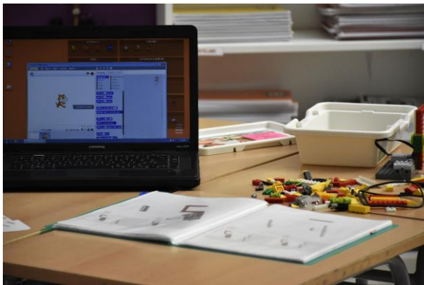
Figura 1. Material a l'escola Carme August

pot sistematitzar a nivell curricular i d'escola? La sensació que teníem era que l'alumnat estava molt motivat, que intuïem que millorava el raonament, que es generava interacció entre iguals, que tenia possibilitat d'aplicar-se a diferents àrees... però ens faltava constatar quin impacte real tenia en l'aprenentatge de l'alumnat i com podíem sistematitzar i donar valor a aquest treball.