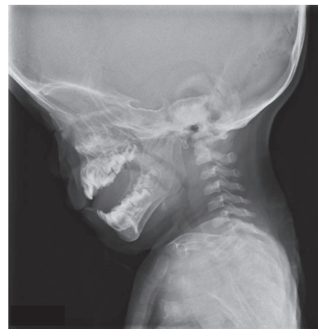
図3 術前の頸部側面からの単純 X 線写真。頭囲と比べて上下顎が小さく，短頸であった。