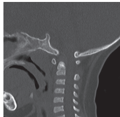
図2 術前の頭頸部 CT 矢状像。大後頭孔部と環椎との癒合は認められなかった。