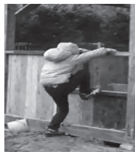
写真4 遊びを妨害され砂場の側の小屋に上がるA男

そしてA男は「バケツを拾う」と「バケツに水を入れる」。こうして砂場における新たな遊びを見つけたA男だったが、「B男に水を入れる順番をぬかされる(SD3)」。 A男は「怒ってB男をたたく、ける」。そして「掘っていた穴に戻る」が「I子に葉っぱを穴に入れられ(SD4)」、「I子に怒る(BFP3)」。 このB男やI子とのやり取り(SD3, SD4)の事象は、やりたい遊びを連続して妨害するためA男の機嫌を損ねさせて砂場から離れるSDとして働くことが考えられたが、A男は「怒って砂場から離れる」ことはなく、「砂場の側の小屋に上がる」のであった(写真4)。