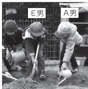
写真6 E男から感謝され再び遊び始めるA男

A男が[積極的にバケツ係を務める]ようになった背景には、先ほど失敗したE男とのコミュニケーションが成功したことによる喜びの感情も一因であると考えられる。幼児は自分の犯した違反状況(本事例の場合、A男が話を否定することでE男を怒らせること)から、時間