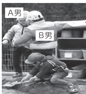
写真3 シャベルを奪われB男をたたくA男

A男は目的を見つけて砂遊びをしていたが、B男にシャベルを奪われる(SD1)ことで、穴を掘って遊ぶことができなくなり、「怒ってB男をたたく」(写真3)。だが、A男はB男からシャベルを返してもらえず、砂場をさまよっていた。