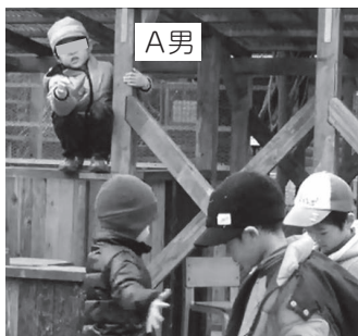
写真5 小屋の上から他児と関わろうとするA男

こうしてA男は[友だちから怒られて黙り込む(BFP4)]。その後、D男、E男はA男の側から離れて行った。A男はしばらく黙り込んだ後、気まずそうにしながら再び友だちのいる[砂場に戻る]。この時([友達から怒られて黙り込む(BFP4)])は、A男にとって遊びにおける