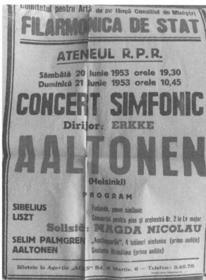
(写真5) ブカレスト公演のポスター (フィンランド国立図書館所蔵)

ブカレスト公演については、HY資料にコンサートのプログラムや新聞記事が所収されるときも (HY 2332) / Coll. 728には公演の写真、ポスター (写真5) など多くの関連資料が保存されていた。