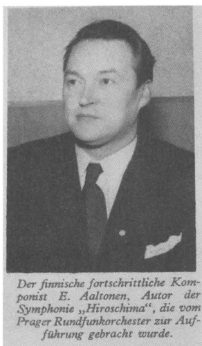
(写真2) 1951年開催の「プラハの春音楽祭」パンフレット(ドイツ語版)最終頁に掲載されたアールトネンの写真