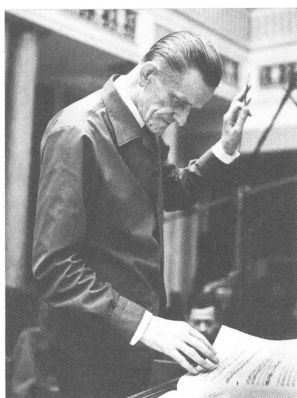
(写真6) ボーダン・ウディチコ (1950年頃)

今回の調査では、先述のワルシャワでの演奏の指揮者がウディチコ (写真6) であったことが判明したが、この事実は非常に興味深