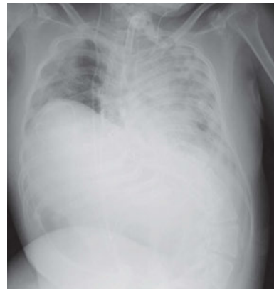
図4 胸部X線写真（第20病日；ステロイドパルス療法終了後4日目） 主に右側肺野全体で透過性の著明な改善を認めた。

第11病日の血液ガス所見は F_{I}O_2 0.75でpH 7.323、PaCO 2 60.2 mmHg、PaO 2 96.8 mmHg、BE +3.3 mEq/Lと低酸素性換気障害が持続した。第12病日の血液検査所見はWBC 6,600/μL（好中球70.0%、リンパ球24.2%、単球3.4%、好酸球2.0%、好塩基球0.4%）、CRP 7.40 mg/dLとCRP高値を認めた。第13病日にシベレスタットを中止した。第14病日よりステロイドパルス療法を開始し、メチルプレドニゾロン 1,000 mgの点滴静注を3日間施行した。ステロイドパルス療法開始前日の血液ガス所見は F_{I}O_2 0.75でpH 7.383、PaCO 2 62.5 mmHg、PaO 2 86.0 mmHg、BE +9.8 mEq/L、PaO 2 / F_{I}O_2 （P/F）比は115、胸部X線所見両側肺野全体のびまん性浸潤影はICU入室時と比較しさらに悪化していた（図3）が、ステロイドパルス療法終了後3日目（第19病日）に F_{I}O_2 0.70でpH 7.483、PaCO 2 48.0 mmHg、PaO 2 85.2 mmHg、BE +10.5 mEq/L、P/F比123、4日目に F_{I}O_2 0.47でpH 7.418、PaCO 2 46.1 mmHg、PaO 2 83.9