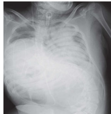
図1 胸部X線写真 (第3病日)

血液検査所見：白血球数 (WBC) 12,600/μL (好中球90.1%，リンパ球6.3%，単球3.4%，好酸球0.0%，好塩基球0.2%)，CRP 12.15 mg/dL