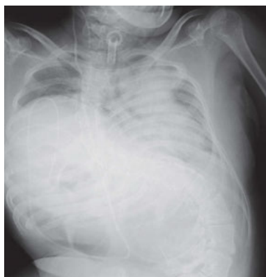
図7 胸部X線写真（第69病日） ICU入室時と比較し，両側肺野の透過性が全体的に改善した。

午前中のみ人工呼吸器から離脱した。第63病日から3日間にわたり39°C以上の発熱があり，血液培養と中心静脈カテーテル先端の培養からCorynebacteriumが検出されたためSBT/ABPCを再度施行し，第65～66病日には38°C以下に解熱し，第66病日にSBT/ABPCを中止した。第75病日には終日にわたり人工呼吸器からの離脱が可能となり，第76病日の胸部X線写真では両側肺野の透過性の全体的な改善を認めたため（図7）ICUを退室し，第121病日に退院した（図5）。