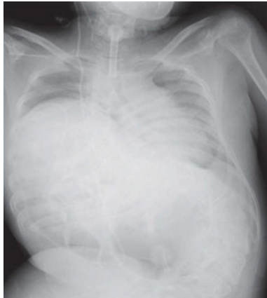
図2 胸部X線写真（第7病日；ICU入室時） 両側肺野でびまん性浸潤影による著しい透過性低下を認めた。