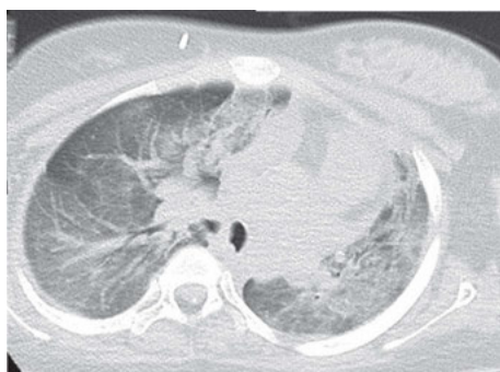
図6 胸部CT（第42病日） 両側肺野全体に浸潤影の残存を認めた。

SBT/ABPC：スルバクタム／アンピシリン，VCM：バンコマイシン，TAZ/PIPC：タゾバクタム／ピペラシリン，CLM：クリンダマイシン，MINO：ミノマイシン，mPSL：メチルプレドニゾロン，DOA：ドバミン，P/F：PaO 2 /F i O 2 比，WBC：白血球