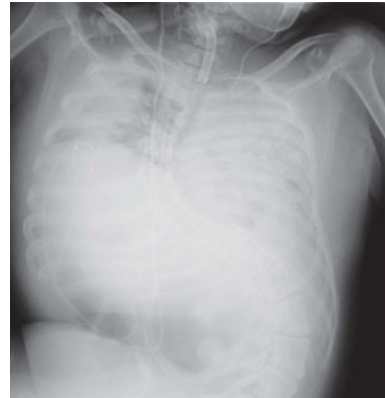
図3 胸部X線写真（第13病日；ステロイドパルス療法開始前日） ICU入室時と比較し、両側肺野でのびまん性浸潤影はさらに悪化していた。

ン・ベネット™ ventilator system 840（日本メドトロニック社、東京）を使用した。人工呼吸器設定を同期式間欠的強制換気（SIMV）とし F_{I}O_2 1.0、プレッシャーコントロール（PCV）20 cmH 2 O、プレッシャーサポート（PS）15 cmH 2 O、呼気終末陽圧換気（PEEP）15 cmH 2 O、呼吸回数（RR）16回/分として人工呼吸管理を開始した。