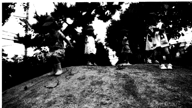
図3 「ひとりで登れた！」

A児は築山に向かって投げたマラカスを取り、そのまま築山をひとりで登り始める。途中からマラカスを杖にして四つん這いになって登りきる。A児が頂上についたとき、すかさず教師が声をかける。「Aちゃん、登れたじゃん！」と大喜びをする。A児は満足そうな表情でしばらく頂上にいる。(図3)