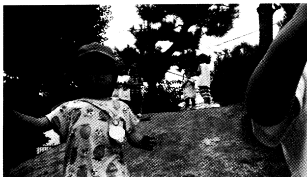
図2 「頂上で躊躇するA児に寄り添うD児」

A児は築山の上でマラカスを持っている。一回転がすが途中友だちの足で止まり、他の子がA児のマラカスを上まで届ける。A児は周りを見る。周りでは、他の子どもたちが思い思いに泥だんごを転がしては登ってきている。A児は転がすことを躊躇している。教師が「Aちゃん、転がしてごらん。大丈夫だよ」と安心させようとする。周りにたくさん人がいると、あたって転んでしまいそうで怖いのであろう。A児は「い～や～だ～」と言い腰がひけている。D児が「なかんのんよ」と心配そうに言う。教師が「D君、Aちゃんの近くまで行ってあげて」と言うと、D児は「トンネル、はいる？」と築山の下で足のトンネルを作る。D児の思いをくみ取り「D君がトンネル転がるかね、だって。コロコロってやっごらん」と教師が言う。A児は周りを見ながらまだ躊躇している。D児はA児のそばにかけよる。(図2) C児もA児の様子に気づき、近寄りA児の手を持つ。するとA児はゆっくり築山を下りてくる。下りきった時、教師が「Aちゃん、また登ってみる？」と声をかけると、A児は額にしわを寄せて「こわいからいやだ」と言う。しかし、すぐまた持っていたマラカスを築山に向かって投げ取りに行く。少し明るい表情になっている。