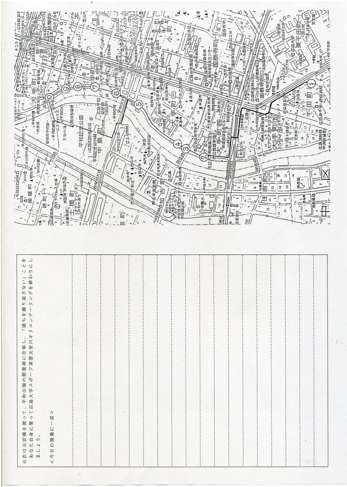
図5 元安川OLマスターマップ