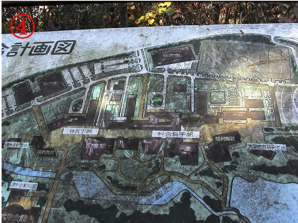
図3 広島大学新キャンパス総合計画における体育学部の配置図