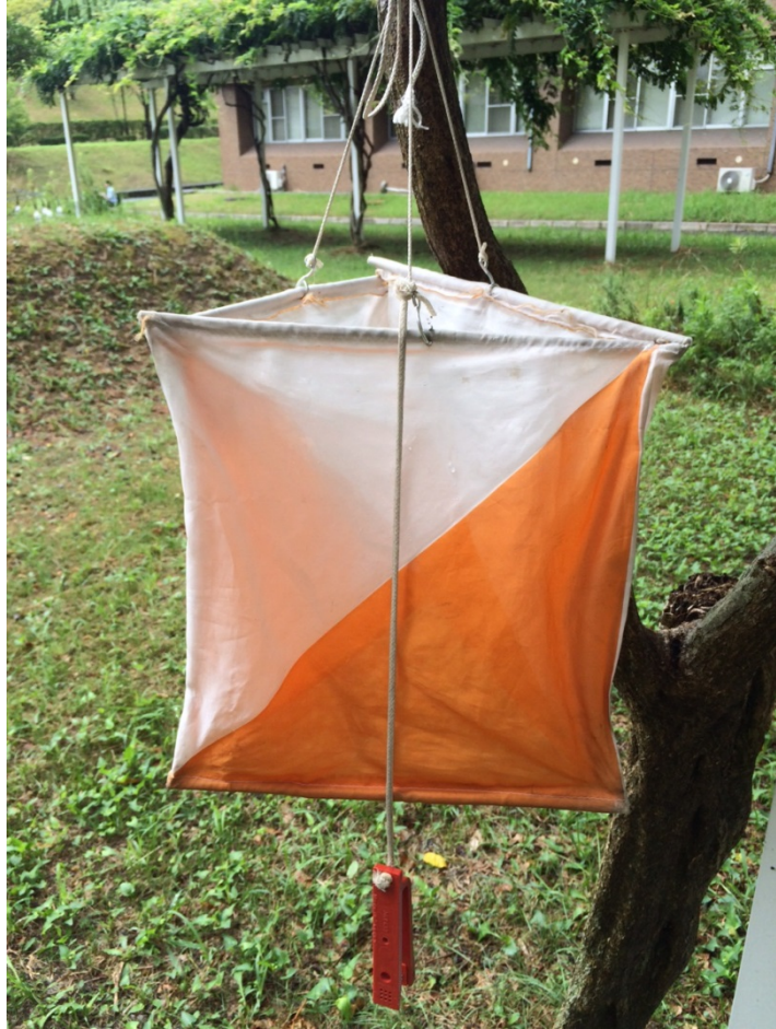
図2 OLポストとスタンプ