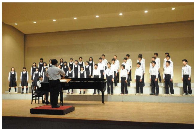
図1 校内合唱コンクールの様子