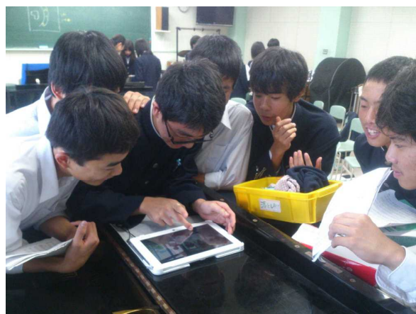
図2 合唱練習の様子