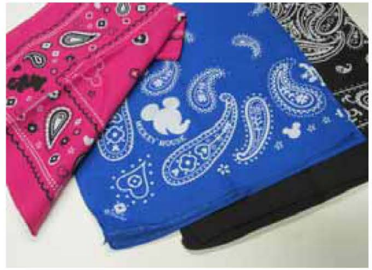
資料1 使用したバンダナ