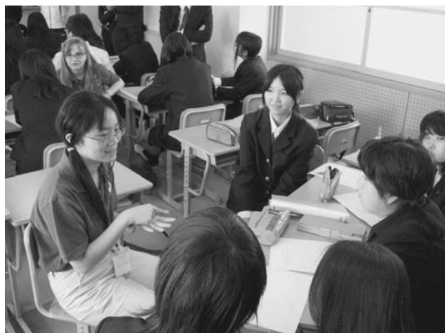
写真2 Odyssey生徒と話し合いをする様子

ディスカッションの具体的な内容は、Odyssey生徒が「ZEN」について簡単な説明を行い、その後小グループに分かれて、本校生徒からの質問を交えながらの情報交換を中心に進めた。giftedと呼ばれる人たちは一般的に、①完璧主義者、②間違ふことはしようとしなない、③チャレンジなことは避ける、④上手にできることだけを繰り返して行うという性向をもっていると考えられている。つまり「ZEN」にはそのような性向を克服するgiftedな生徒を育成する考えが込められている。例えば、「Are you still painting the same picture? (いつも同じ絵を描いていて成長があるのか)」という問いを生徒に投げかけている。Odyssey生徒が「ZEN」の各条の意味と具体的な行動への反映について説明した。Odyssey生徒は、日本語と英語の両方を使いながら本校生徒が理解できるよう丁寧に説明した(写真2)。