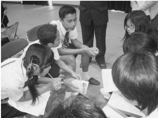
写真1 インタビュー活動をする生徒たち