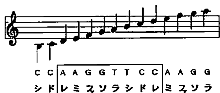
図1 塩基を音符に変換するルール (Ohno and Ohno 1986 の図を改変)