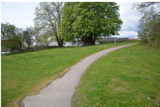
Terrängskillnader och ett populärt kastanjetråd att leka vid.

Gården har höjdskillnader. Framför allt i den vilda zonen återfinns höjdskillnaderna men även i den vidlyftiga zonen. Skogspartiet ligger uppför en sluttning. I ett parti av gården med gräsytor som gränsar mellan den vidlyftiga och den vilda zonen finns också terrängskillnader. Detta området består av backar med gräs. Ett stort kastanjetråd och stora stenar. Gräsbacken agerar en bra pulkabacke på vintern.