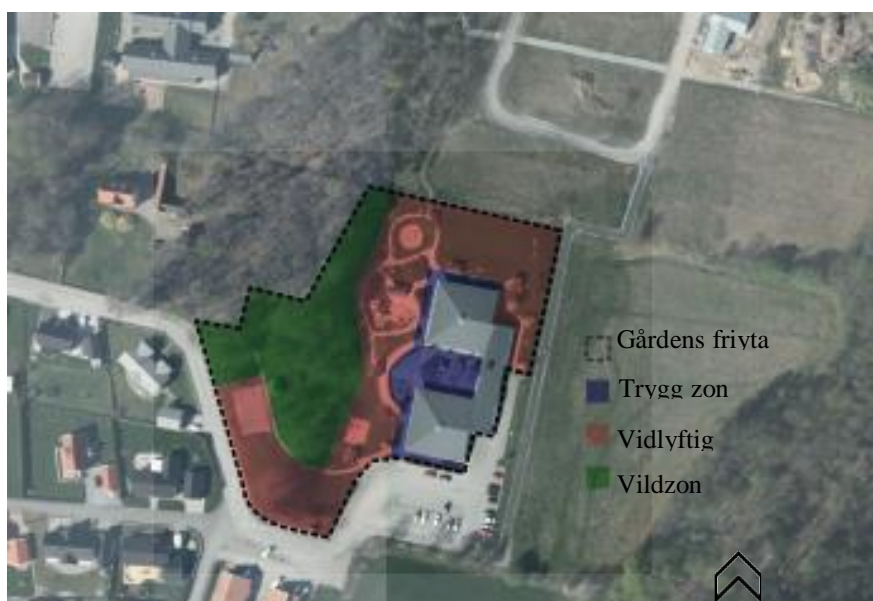
Zonernas placering på gården.

Gårdens storlek gör att det finns gott om varierande miljöer. Gårdens olika delar har olika karaktärer som representerar de tre olika zonerna. Den trygga, den vidlyftiga och den vilda zonen. Den trygga zonen återfinns närmast byggnaden och upplevs ganska liten. Här finns bänkbord som är placerade under byggnadens utskjutande hustak. På vissa platser finns markiser som kan användas som väderskydd. Det finns gott om bänkar och bord för lugnare aktiviteter. Gårdens storlek gör att det finns gott om platser för att dra sig undan och vila i lugn och ro om man behöver. Även utanför den trygga zonen finns det platser där man kan vistas i lugn och ro. Det går att hitta avskärmade platser eftersom det finns gott om vegetation. Det finns också bänkar utspridda över gården.