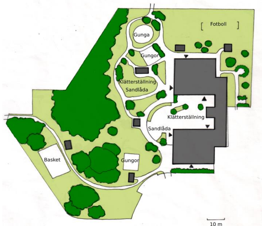
Illustrationsplan över gårdens nuvarande utformning.

På Asarumsdalens förskola går cirka 100 barn i åldrarna ett till fem år. Tre avdelningar har yngre barn och tre avdelningar har äldre barn. När barnen vistas ute på gården bär de västar i olika färger som representerar de olika avdelningarna. Detta för att man lättare ska kunna se vilken avdelning barnen tillhör. Förskolans gård är stor och har varierande miljöer. Det finns mycket vegetation av olika karaktär. Det finns också en stor variation av markmaterial på förskolegården. Under en del lekturstyrning finns grus och under en del lekturstyrning gummi-asfalt. En stor del av den hårdgjorda ytan på gården består av plattsättning. Två olika betongplattor har använts för plattsättningen. Även asfalt finns att finna på gården i form av slingrande gångar runt gården. Gården har stora ytor med gräs. Det finns prefabricerad lekturstyrning.