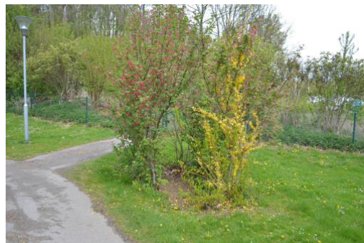
I den vidlyftiga zonen finns små buskage som man kan leka i.