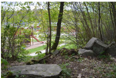
Skogspartiet i den vilda zonen.