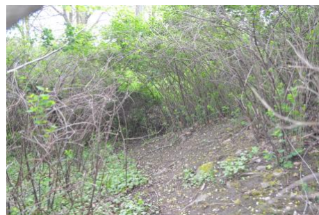
Buskage som bjuder in till kojbyggen i den vilda zonen.