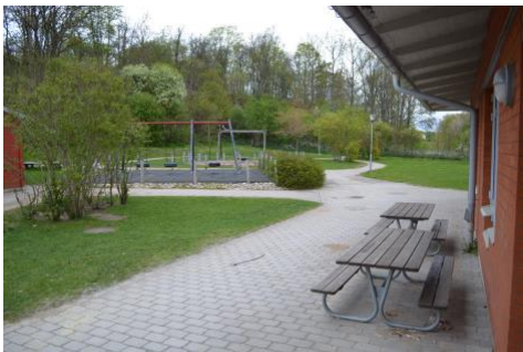
Den trygga och den vidlyftiga zonen går tätt ihop.

Pedagogerna uppskattar att gården innehåller både tillrättalagd miljö men också miljöer där barnen kan använda sin fantasi mer. I skogspartiet kan barnen träna motorik och de kan titta på växter och djur. Den ger också stora möjligheter för barnen att utforska och upptäcka.