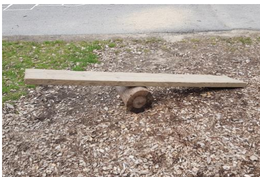
Med en gungbräda kan man förutom att gunga lära sig om naturkrafter. Och gungbrädan kan placeras där leken finns.

Vid samtal med pedagogerna så framkom önskemål om motorikbanor. Genom lösa material kan barnen själv konstruera motorikbanor som sedan kan byggas om hur många gånger som helst. Det erbjuder konstruktionslek och stimulerar problemlösning och kreativitet. Det lösa materialet kan användas på många sätt. Istället för mer prefabricerade gungor som personalen önskade skulle man kunna erbjuda barnen material för att skapa egna gungbrädor. Det skulle förutom att erbjuda barnen möjlighet att gunga ge barnen möjlighet att träna på konstruktion och lära sig om naturkrafter. Det lösa materialet kan också användas för att bygga kojor, bord och stolar. Barnen får använda sin fantasi och träna skapande. Genom att ha flyttbara vägskyltar kan barnen träna på trafikregler samtidigt som de kan bygga upp sin egna lilla stad. Att kunna träna trafikregler var också ett önskemål som fanns för att koppla med cyklarna.