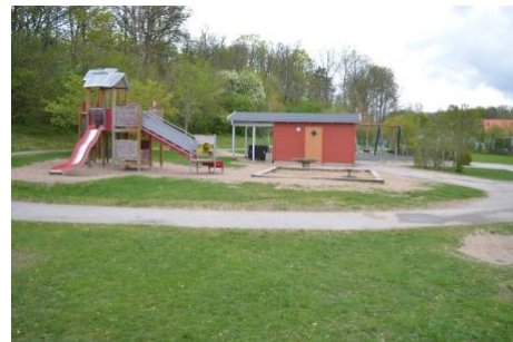
På Asarumsdalen har den vidlyftiga zonen mycket prefabricerad lekutrustning.