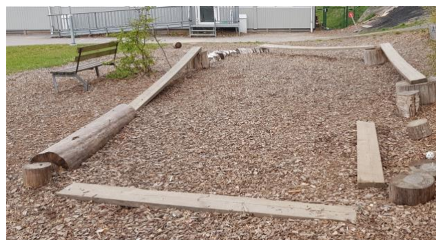
Med lösa material kan man bygga egna motorikbanor. De kan dessutom byggas om ändras efter behov.