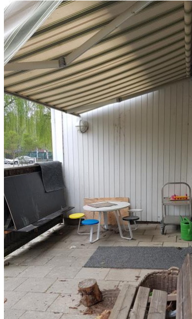
Om man har en målarateljé utomhus är det lätt enkelt att skapa även utomhus.

På Asarumsdalens förskola har man inga odlingsmöjligheter. Genom att tillföra odlingslådor, kompost och växter med ätbara frukter och bär kan man tillföra stora pedagogiska värden. Platser där utomhuspedagogik skulle kunna användas i stor utsträckning.