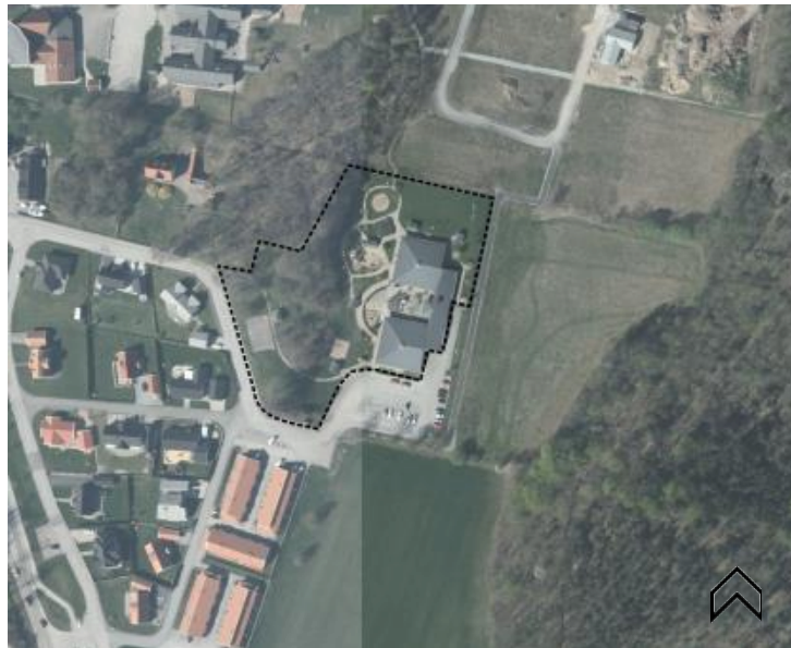
Förskolans placering i det omgivande landskapet.

Asarumsdalens förskola ligger i Asarum som är en del av tätorten Karlshamn i Blekinge. Asarum är beläget strax utanför Karlshamns stadskärna och har drygt 7800 invånare (Karlshamn kommuns hemsida, 2019a). Förskolan ligger i anslutning till ett villaområde och en bit åkermark. I närheten finns också ett skogsområde.