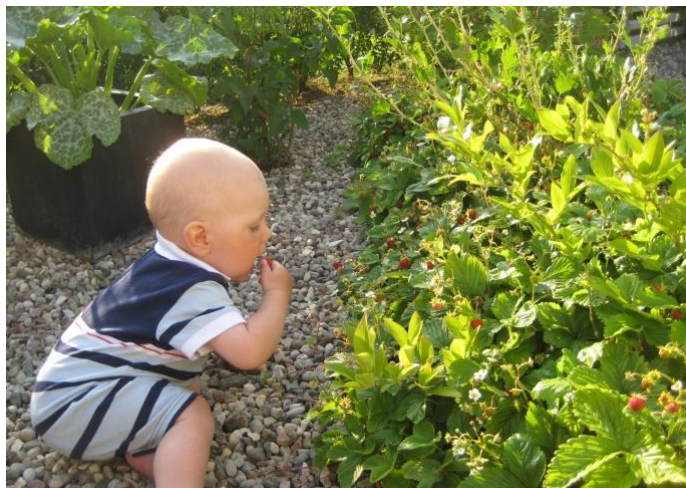
I trädgårdslandet får man smaka och lukta på goda grönsaker, frukter och bär.

Ett trädgårdsland kan vara en viktig pedagogisk resurs på en förskolegård. För ett barn kan det vara en fantastisk upplevelse att se ett litet frö växa och bli till stora grönsaker, frukter och blommor. Genom odling får barnen lära sig att visa tålamod under tiden det växer och de lär sig att ta ansvar och att vårda. Trädgårdslandet erbjuder många möjligheter till inläring. Naturens kretslopp blir tydligt för barnen när de arbetar med odling och kompost (Åkerblom, 2005).