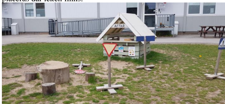
Med lösa material kan man bygga egna städer och med flyttbara vägskyltar kan man träna trafikregler.