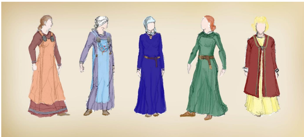
Slika 5: primjeri ženskog odijevanja nordijskih plemena

zlata. U toj škrinji je bio nož. Već spomuta škrinja može biti komad nakita koje arheolozi zovu konkavni broš. Konkavni broševi su pronađeni u različitim dijelovima Europe gdje su se Vikinzi nastanili, uključujući Englesku, Irsku, Rusiju i Island. Ti pronalasci ukazuju kako je moguća prisutnost vikinških žena na ekspedicijama. 72 Istraživanje pokazuje kako su danske žene u to doba preferirale jednostavne donje haljine dok su Šveđanke nosile karirane. Također se govori kako je donja haljina bila nabrana u vratu i takav ovratnik se pričvršćivao brošem. Žene koje su prve došle za svojim muškarcima u Englesku nosile su naizgled plisirane, najvjerojatnije gusto nabrane lanene donje haljine kratkih rukava.