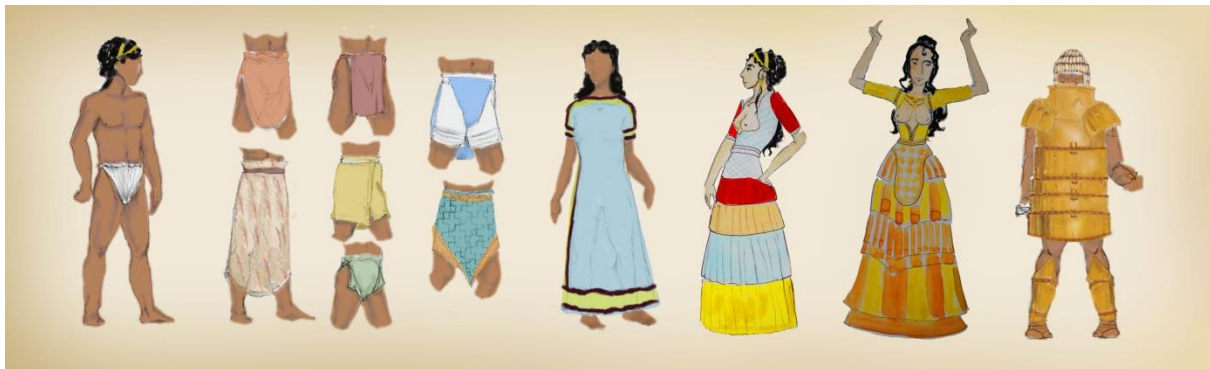
Slika 1: primjeri odijevanja mikenske i minojske kulture

grudi s velikim ukrasnim vezanjem na leđima dok kraj ukrašen resama visi do struka. 22 Suknja je stožastog oblika načinjena ili od mnogostrukih nabranih komada tkanine ili od jednog komada. Freske prikazuju kako su se nabrani komadi tkanine našivali na temeljnu suknju, od tri komada do sedam ili devet svaka tkanina seže upravo toliko kako bi sakrila šav one ispod. Suknje su bojane i ukrašene raznolikim geometrijskim ornamentima uzorka koji se ponavlja. Preko suknje se nosio komad tkanine elipsoidnog oblika a dulji krajevi tkanine padaju naprijed i straga poput pregače, on je također bogato ukrašen. U iznimno uskom struku suknju pridržava ili preko jakne nadodaje kao ukras deblji široki pojas koji skriva spoj ovih odjevnih predmeta. Na glavi se nosi visoki šešir ili turban, šešir je naizgled konstruiran od komada okrugle ili ovalne tkanine koji se stezao po želji nositeljice stvarajući oblik koji joj najviše odgovara. Korištenje fibula ili igala nije vidljivo na niti jednom prikazu, na kipićima zmijske božice i njene svećenice pronađene u Knosu vidljivo je vezanje jakne sprijeda trakama ali nikakve druge indikacije spajanja tkanina nije vidljiva. Oblik odjevnih predmeta se izgledao dobivao krojenjem i sposobnim šivanjem.