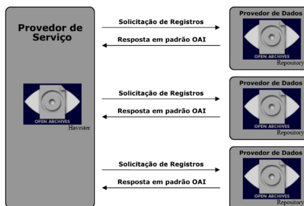
Figura 2: Fluxo de informação nos Provedores de Serviços