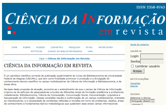
Figura 3 - Ciência da Informação em revista - Index

Na segunda etapa, acessamos os links coletados de modo a verificar se esses títulos faziam uso do OJS e do protocolo OAI/PHM. Para tanto, dois procedimentos foram adotados: o primeiro, que se mostrou menos eficiente, foi acessar as páginas intituladas “about”, “sobre”, “acerca de” ou equivalentes, conforme a origem do periódico; o segundo, que se mostrou mais eficiente, foi apagar a expressão “index” ao final do URL do periódico e adicionar a combinação “/oai”, como apresentamos a seguir.