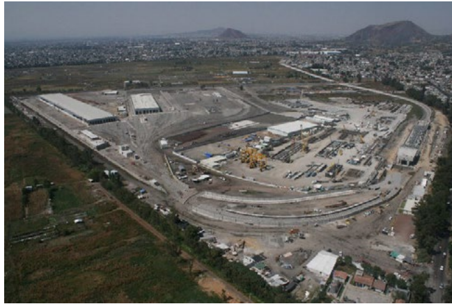
Figura 3. Construcción de la terminal de la Línea 12 en Terremotitla

Hubo, además, un artilugio legal que los proponentes del proyecto habían tramado previamente: la asamblea de dominio pleno que hacía innecesaria la asamblea ejidal para la venta de las tierras. Pocos sabían que esa asamblea se había dado un lustro antes y que algunos de los ejidatarios ya habían autorizado la obra y vendido sus parcelas. Empero la mayoría no estaba informada que su espacio ejidal había sido jurídicamente transformado en suelo urbano.