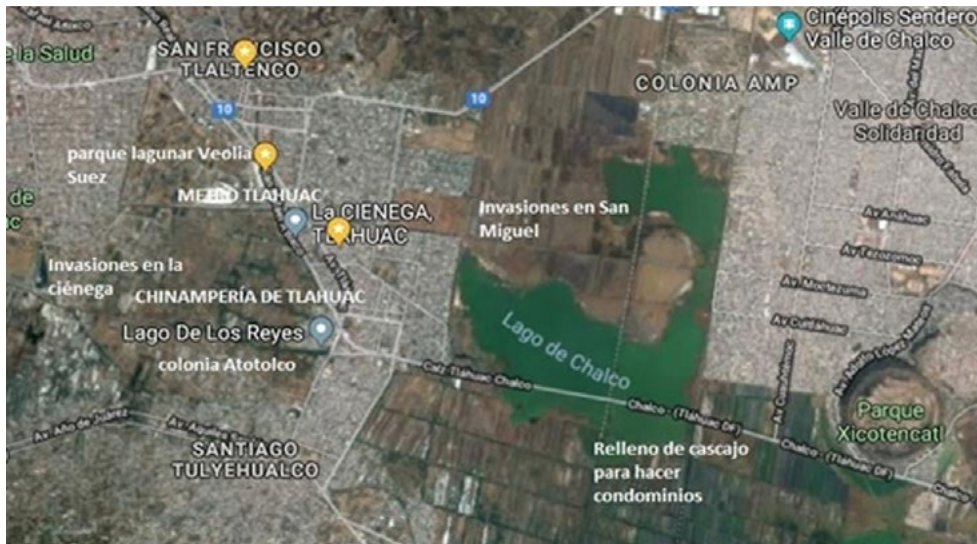
Figura 2. Chinamperías de Tlahuac. Mapa elaborado por Antelmo García

vender bajo la consigna zapatista: “la tierra no se vende, se ama y se defiende” Las otras dos solicitaban la venta de tierras o la permuta de las mismas.