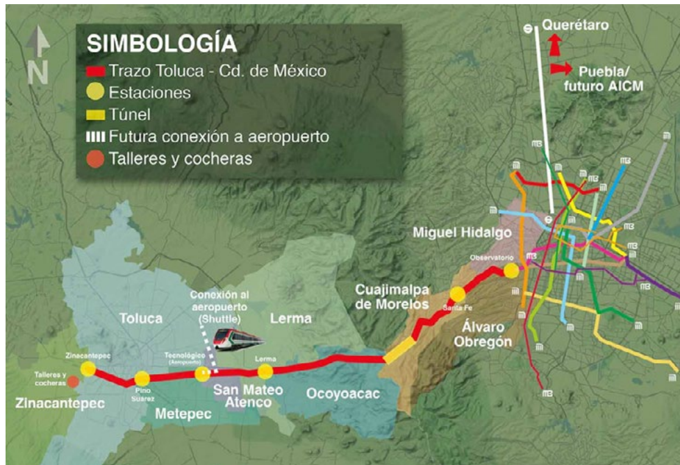
Figura 4. Tren México-Toluca.

e ICA. Estas empresas participan activamente de la agenda de grandes obras gerenciada por el Estado 11 .