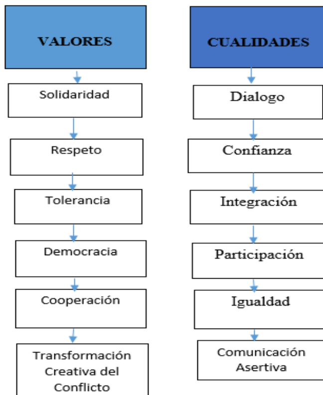
Imagen 1.- Valores y Cualidades