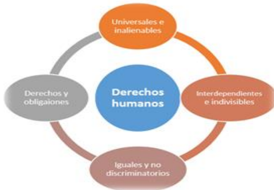
Imagen 3.- Principios de los Derechos humanos.

Fuente: Adaptado de (Naciones Unidas Derechos Humanos Oficina del Alto Comisionado, 2008.).