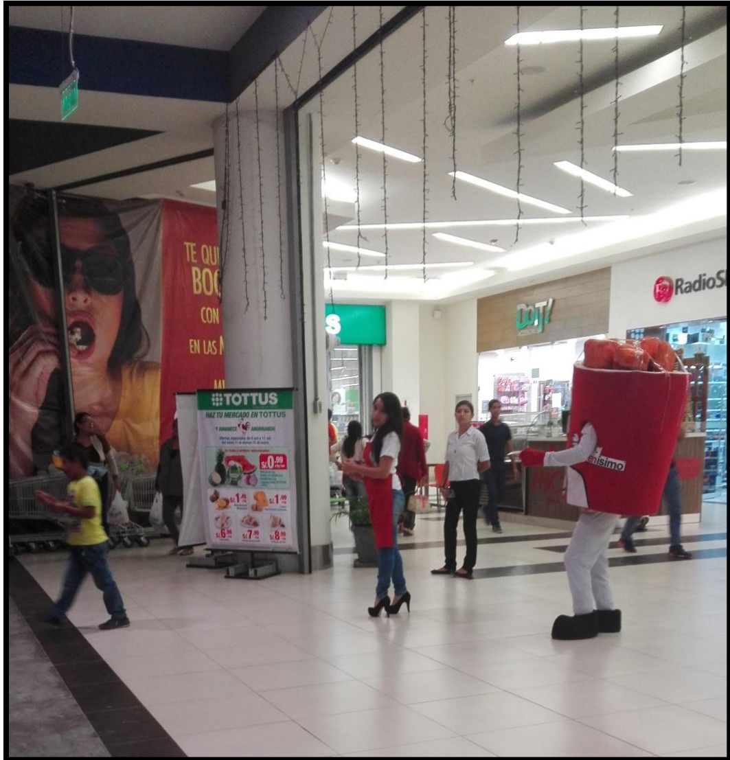
VOLANTE DE FLYERS PROMOCIONALES POR EL CENTRO COMERCIAL