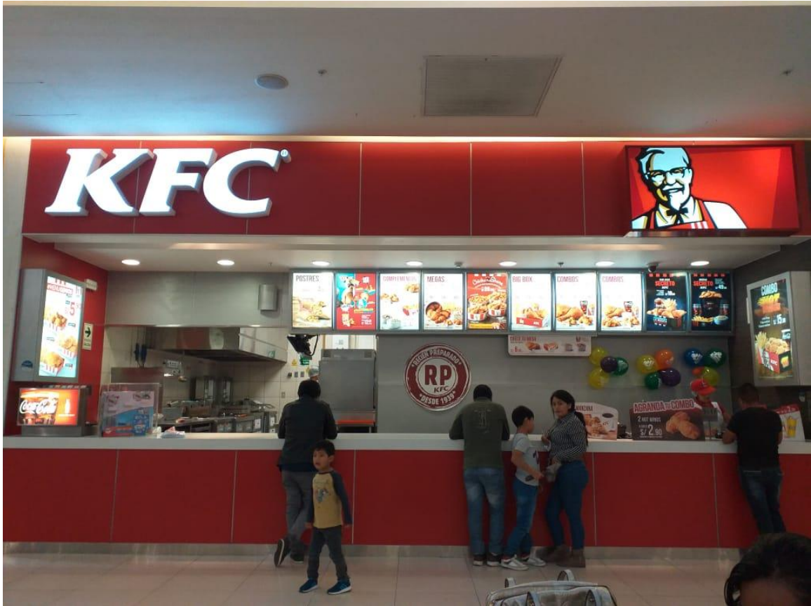
KFC 118 – OPEN PLAZA