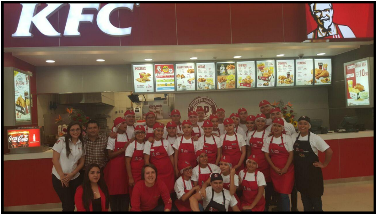
Reuniones Mensuales - Motivacionales