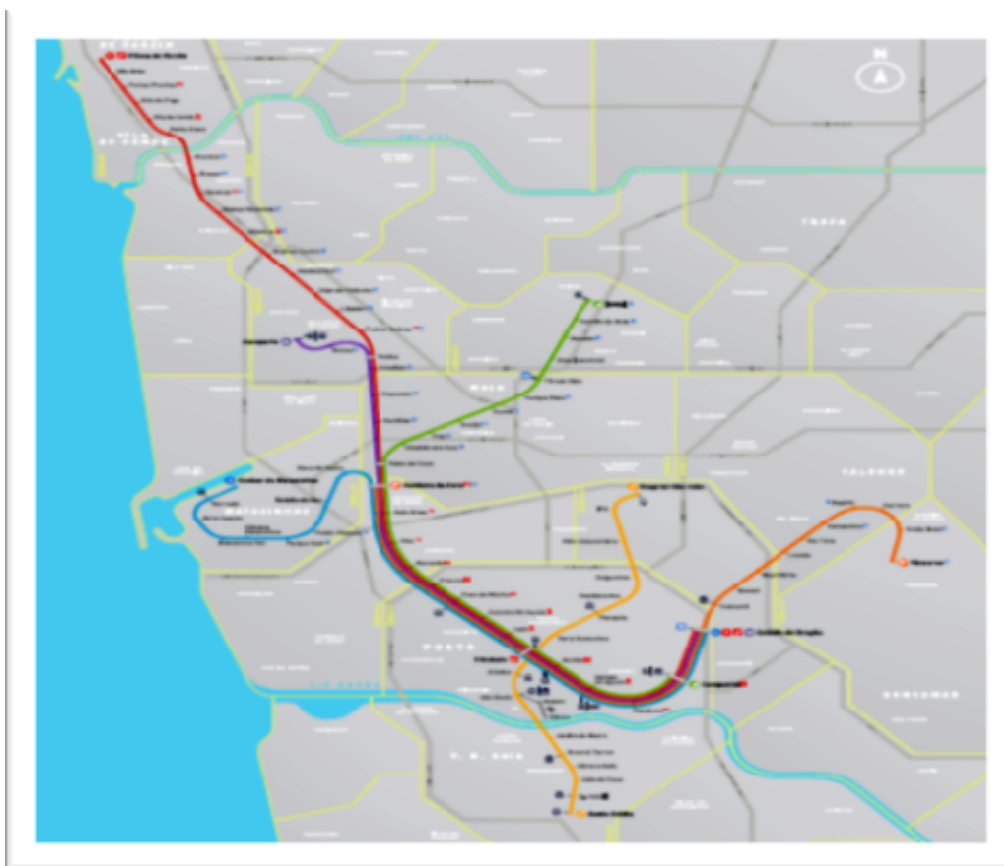
Figura 2 - Linhas do Metro do Porto.

Quanto aos motivos de deslocamento, 41% das viagens no interior da cidade são de regresso à residência, 34% para trabalho e 25% para estudo e outros motivos (ALMEIDA, 2015). O índice de mobilidade do Porto é de 3,2 viagens por habitante (viagens/hab). Considerando-se apenas a população móvel, o índice de mobilidade passa para 4,3 viagens/hab, enquanto que o percentual de pessoas que não se deslocam é de 24,6%. A taxa de motorização na cidade (veículos/1000 habitantes) passou de 334,8 (2001) para 439,24 (2011), o que representa um aumento de 31% no período de dez anos (ALMEIDA, 2015).