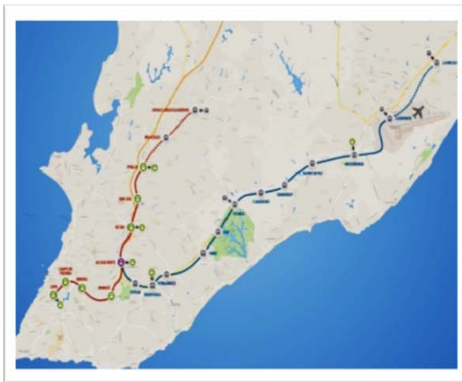
Figura 3 - Linhas do Metro de Salvador